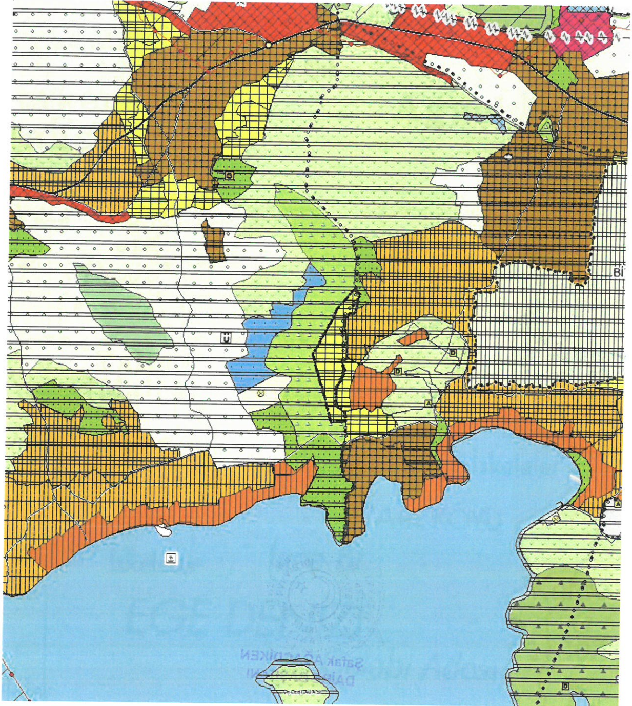
Şekil 3. ÇDP Değişikliği

alanı, ilkokul alanı, sağlık tesis alanı, teknik altyapı alanı ve park olarak planlanması amacıyla içerisinde konut alanı ve ilişkili donatıların yer alabileceği "kentsel gelişme alanı" olarak düzenlendiği Aydın-Muğla-Denizli Planlama Bölgesi 1/100.000 Ölçekli Çevre Düzeni Planı Değişikliği hazırlanmıştır.