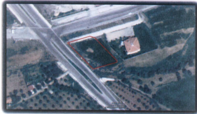
Şekil 2: Planlama Alanı Uydu Görüntüsü

Planlama alanı geneli düz bir yapıya sahip olup alanın en yüksek noktası için rakım 385 m. en düşük notası için ise 383 m. olarak tespit edilmiştir.