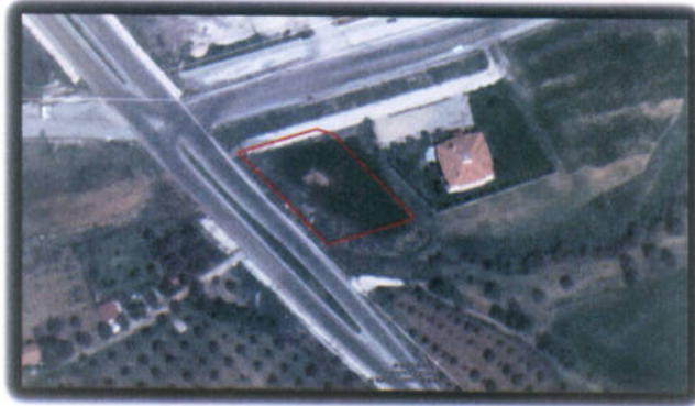
Şekil 2: Planlama Alanı Uydu Görüntüsü

Planlama alanı geneli düz bir yapıya sahip olup alanın en yüksek noktası için rakım 385 m. en düşük notası için ise 383 m. olarak tespit edilmiştir.