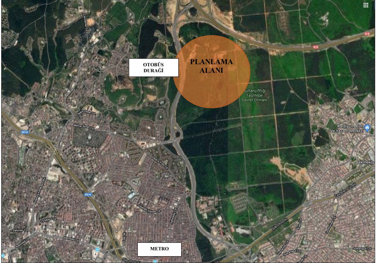
Harita 4 Planlama Alanı ve Çevresine Yönelik Ulaşım Şeması

Planlama alanının kuzeyinde Avrupa Otoyoluna bağlanan O-7 bağlantı yolu, batısında ise Çekmeköy kavşağı bağlantı yolu bulunmaktadır. Planlama alanına Çekmeköy kavşağı bağlantı yolu ve yan yollarından giriş yapılabilmesi mümkündür.