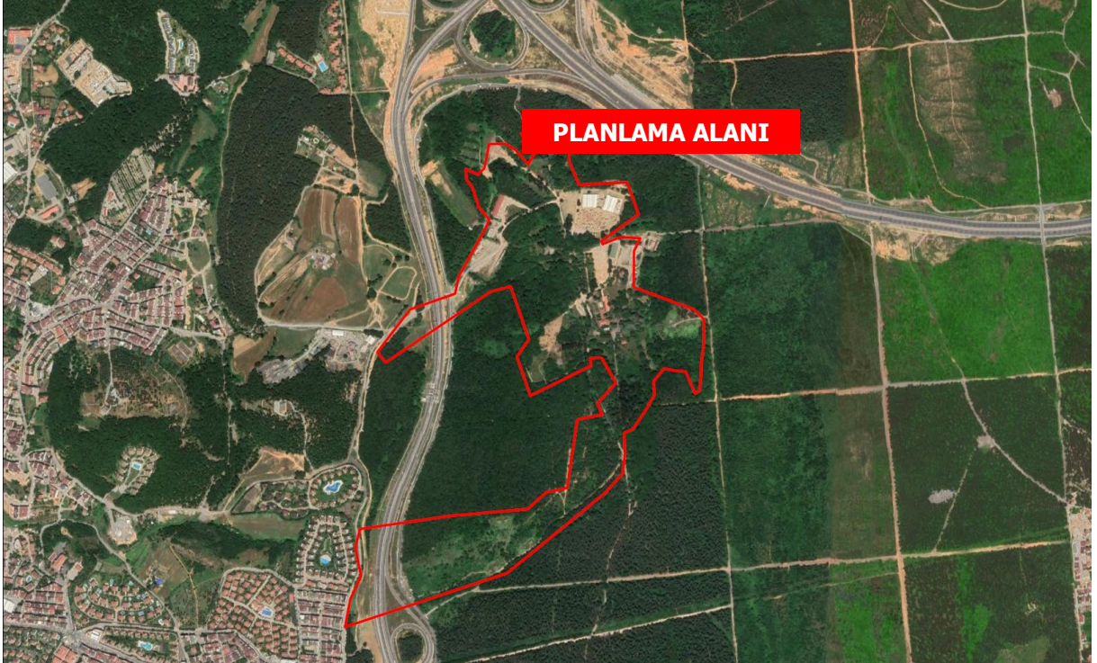
Harita 3 Planlama Alanının Yakın Çevre Uydu Görüntüsü