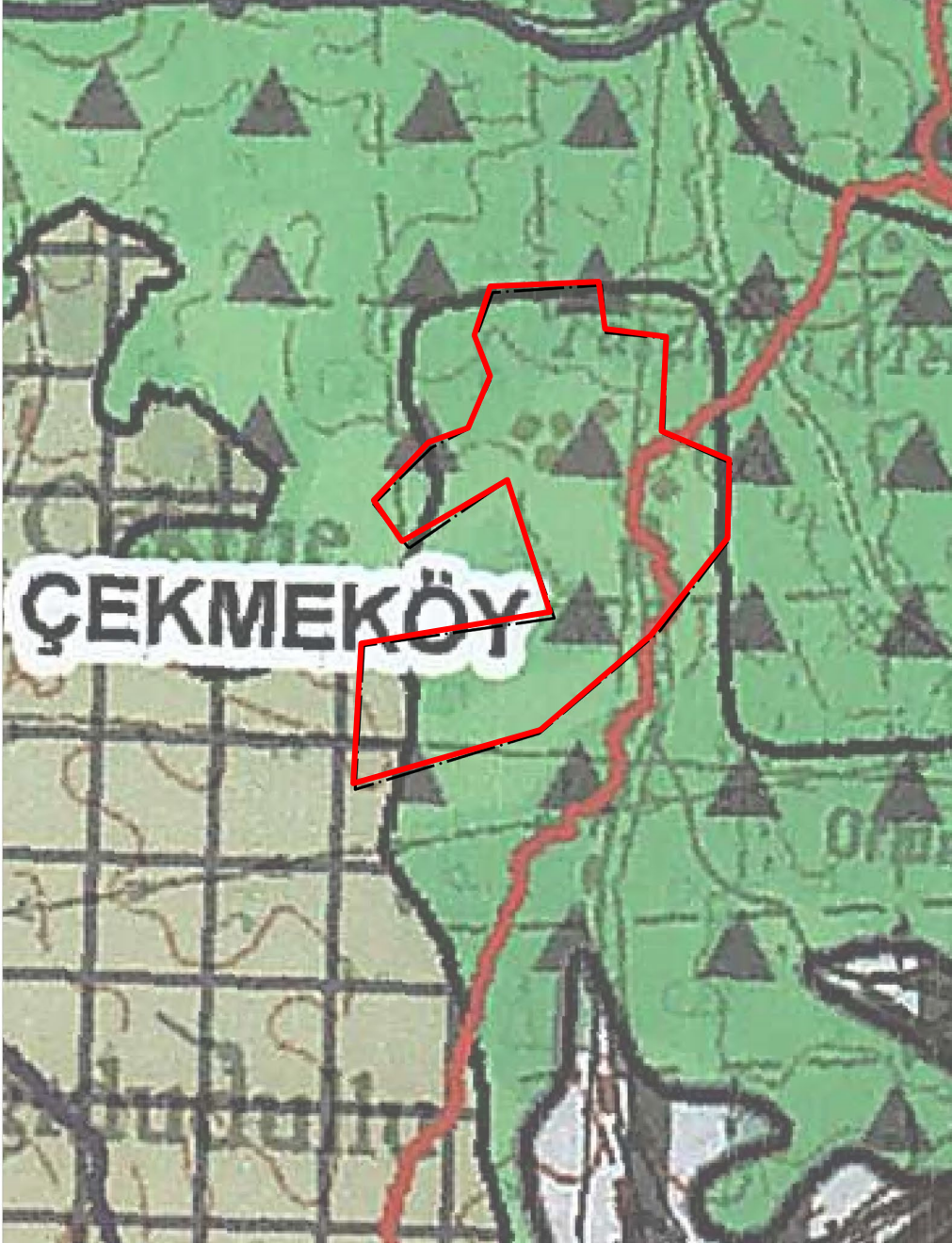
Harita 5 1/100.000 Ölçekli İstanbul Çevre Düzeni Planı

Planlama Alanı 15.06.2009 tasdik tarihli ve 1/100.000 Ölçekli İstanbul Çevre Düzeni Planı'nda yer almaktadır. Mezkûr planda "Orman Alanı" lejantında yer almaktadır. (Harita-5)