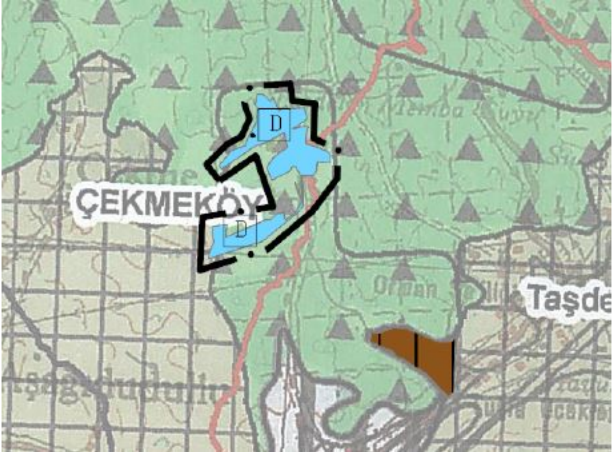
Harita 6 1/100.000 Ölçekli Çevre Düzeni Planı Değişikliği

Bu doğrultuda ve yukarıda belirtilen hedef ve amaçlar kapsamında İstanbul İli, Çevre Düzeni Planı Değişikliği aşağıdaki gibidir.