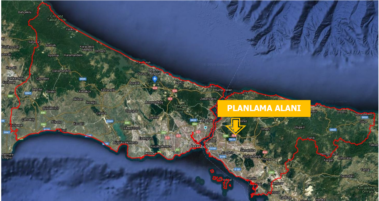
Harita 1 Planlama Alanının İli İçindeki Konumu

Söz konusu alan O-6 otoyolu ve bağlantı yolu ile çevrilidir. Bölge site tarzı konut yapılanmaları ve devlet ormanlarının oluşturduğu bir doku içerisinde yer almaktadır.