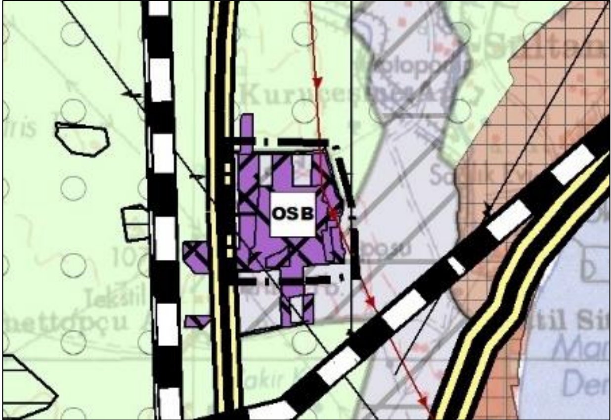
Marmaraeğlisi OSB İlave Alanına yönelik 1/100.000 Ölçekli ÇDP Değişikliği

Tekirdağ İli, Marmaraeğlisi İlçesi sınırları içerisinde yaklaşık 26 hektarlık alanı kapsayan ve Sanayi ve Teknoloji Bakanlığı'nın 31.05.2022 tarihli ve E.3709059/59 sayılı yazısı ile sınırları kesinleştirilen Marmaraeğlisi OSB İlave Alanının Trakya Alt Bölgesi Ergene Havzası 1/100.000 ölçekli Revizyon ÇDP'nin F19 no'lu plan paftasında (plan değişikliği onama sınırı içerisinde kalan alan) " Organize Sanayi Bölgesi (OSB) " olarak gösterilmesine yönelik düzenleme yapılmıştır.