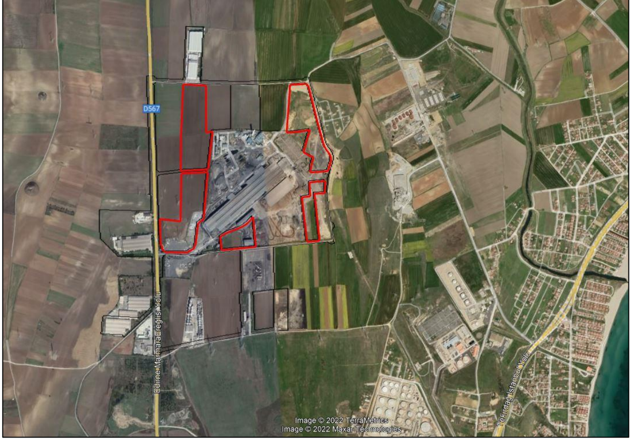
OSB İlave Alan Uydu Görüntüsü

olmak üzere veya tarım dışı amaçla kullanımına yönelik olarak Bakanlık Makamınca verilmiş kamu yararı kararı bulunmamakta olup hem yer seçimi aşamasında hem de Sanayi ve Teknoloji Bakanlığınca onaylı imar planlarına yönelik Tarım ve Orman Bakanlığı tarafından verilmiş olumsuz bir görüş ve tüm bu süreçte açılmış herhangi bir dava bulunmadığı hususları ifade edilerek Sanayi ve Teknoloji Bakanlığınca sınırları kesinleştirilen Marmaraereğlisi OSB İlave Alanının yürürlükte bulunan ÇDP’de düzenlenmesinde sakınca bulunmadığı bildirilmiştir.