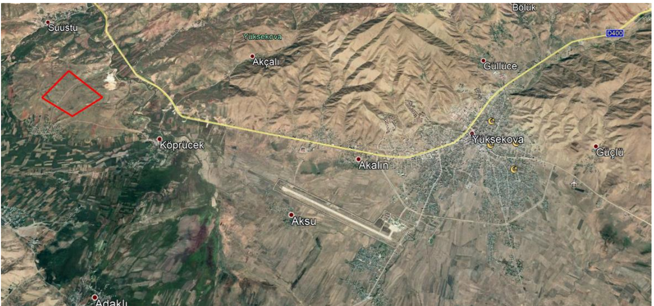
Planlama Alanı - Uydu Görüntüsü

Konuya ilişkin, Sanayi ve Teknoloji Bakanlığı'nın (Sanayi Bölgeleri Genel Müdürlüğü) 26/08/2020 tarihli ve 37419779-453.01-1839611 sayılı görüş yazısında " Hakkari İli, Yüksekova İlçesi, Büyükçiftlik Beldesi, Kerem/Zeydan Köyü'nde bulunan 174 ada 26 parsel no'lu yaklaşık 145 hektar büyüklüğündeki alanın 26/12/2019 tarihli ve 1173676 sayılı yazı ile 'Hakkari Yüksekova OSB' yeri olarak kesinleştirildiği, söz konusu taşınmazın, Hakkari Yüksekova OSB tüzel kişiliğine bedelsiz devir edilmesinde ve Mardin-Batman-Siirt-Şırnak-Hakkari Planlama Bölgesi 1/100.000 ölçekli ÇDP'ye OSB alanı olarak işaretlenmesinde sakınca bulunmadığı " belirtilmiştir.