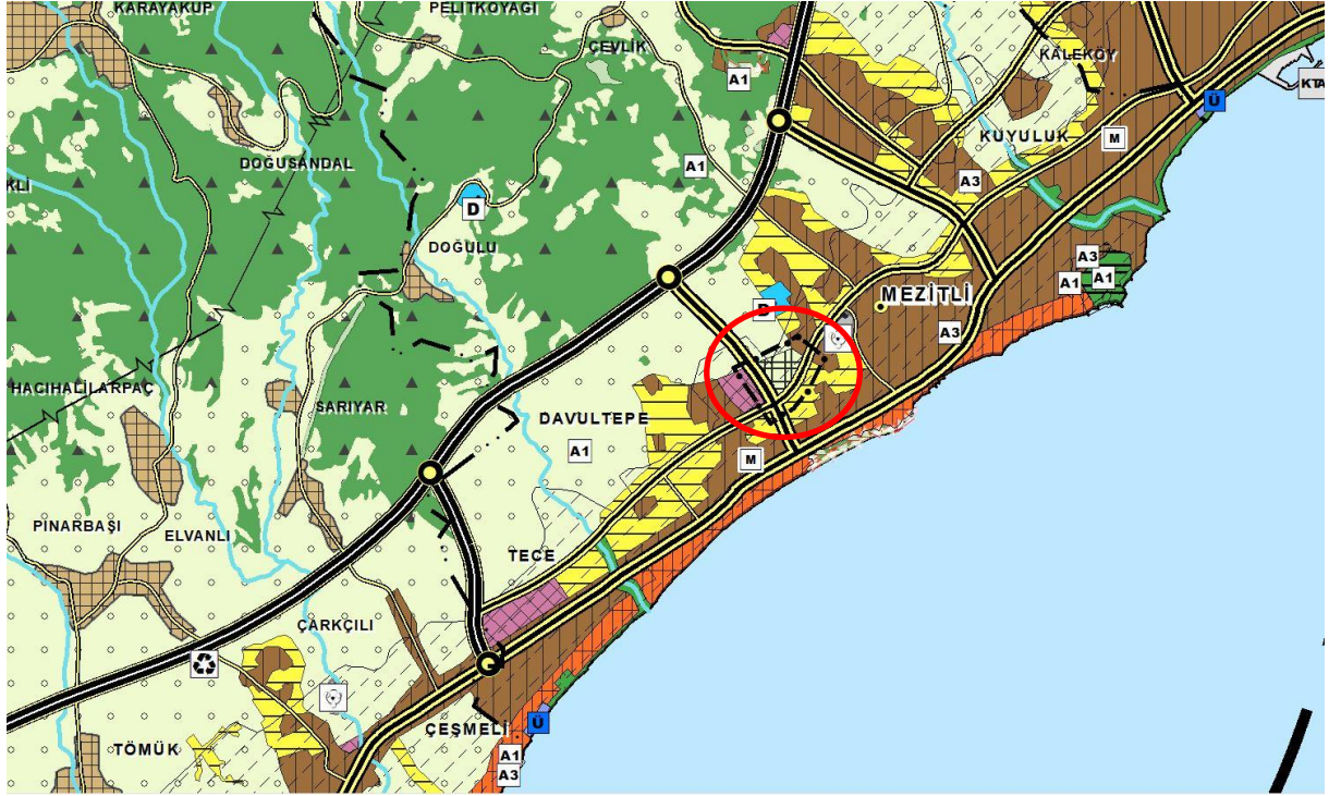
"Organize Tarım ve Hayvancılık Alanı" amaçlı Mersin-Adana Planlama Bölgesi 1/100.000 ölçekli Revizyon Çevre Düzeni Planı Değişikliği