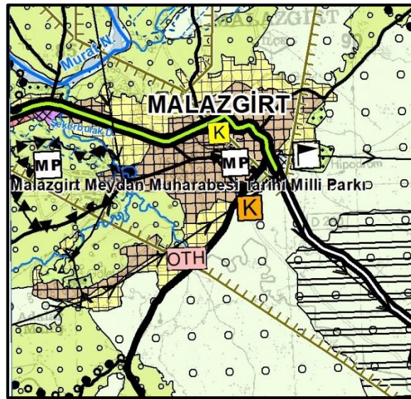
Muş-Bitlis-Van Planlama Bölgesi 1/100.000 Ölçekli Çevre Düzeni Planı Değişikliği