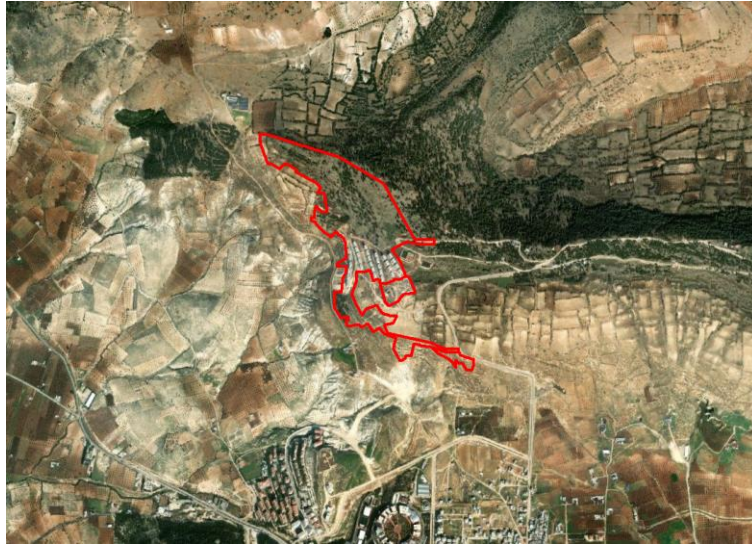
Şekil-1: Kilis İli Merkez İlçe, 1-2-3-4 Kesin İskan Alanlarının Uydu Görüntüsü

4-Kilis İli, Merkez İlçesi sınırları içerisinde; 25.10.2024 tarihli Bakanlık Makamı Oluru ile belirlenen Kilis Merkez Atatürk ve Tamburalı Mahallesi 2. İlave İskan Alanının; Kilis İli 1/100.000 Ölçekli Çevre Düzeni Planında genel arazi kullanım "kentsel gelişme alanı" ve "orman alanı" olarak tanımlanan alanlarda yer aldığı tespit edilmiştir.