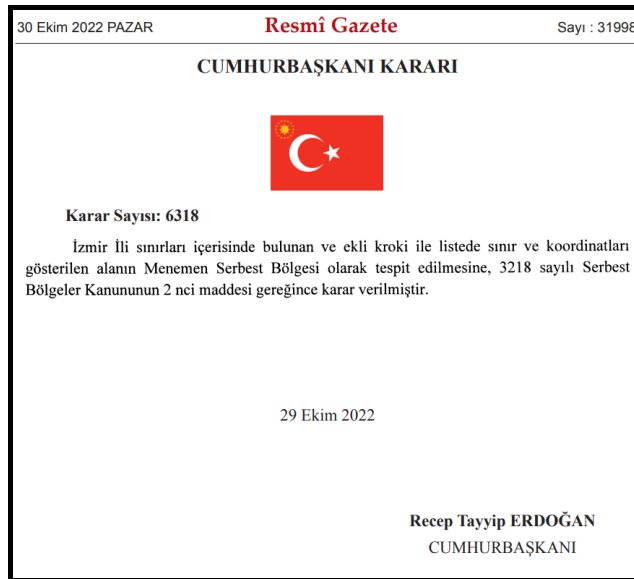
Şekil-1: SB ilanına ilişkin Cumhurbaşkanlığı Kararı

-Bakanlar Kurulunun 2016/9620 sayılı Kararı ile büyük ova ilan edilen Menemen (Gediz) Ovası sınırları içerisinde yer aldığı hususları tespit edilmiştir.