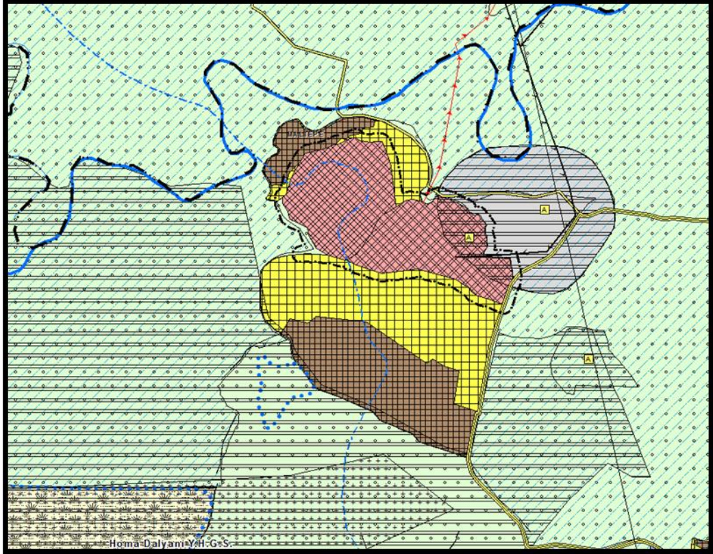
Şekil-4: ÇDP Değişikliği

Bu kapsamda İzmir İli, İlçesi sınırları içerisinde yer alan Menemen Serbest Bölgesi ile İzmir Serbest Bölgesinin bulunduğu yaklaşık 299.2 hektarlık alanın İzmir-Manisa Planlama Bölgesi 1/100.000 Ölçekli Çevre Düzeni Planında "serbest bölge" olarak düzenlendiği ve plan değişikliği çerçevesinde yukarıda yer alan plan hükümlerinin düzenlendiği, İzmir-Manisa Planlama Bölgesi 1/100.000 Ölçekli Çevre Düzeni Planı Değişikliği hazırlanmıştır.