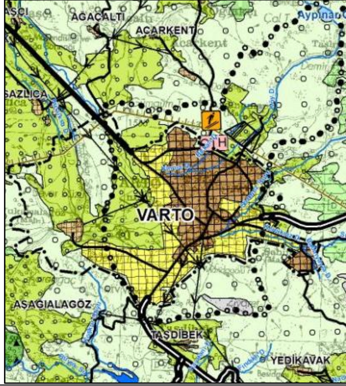
Muş-Bitlis-Van Planlama Bölgesi 1/100.000 Ölçekli Çevre Düzeni Planı