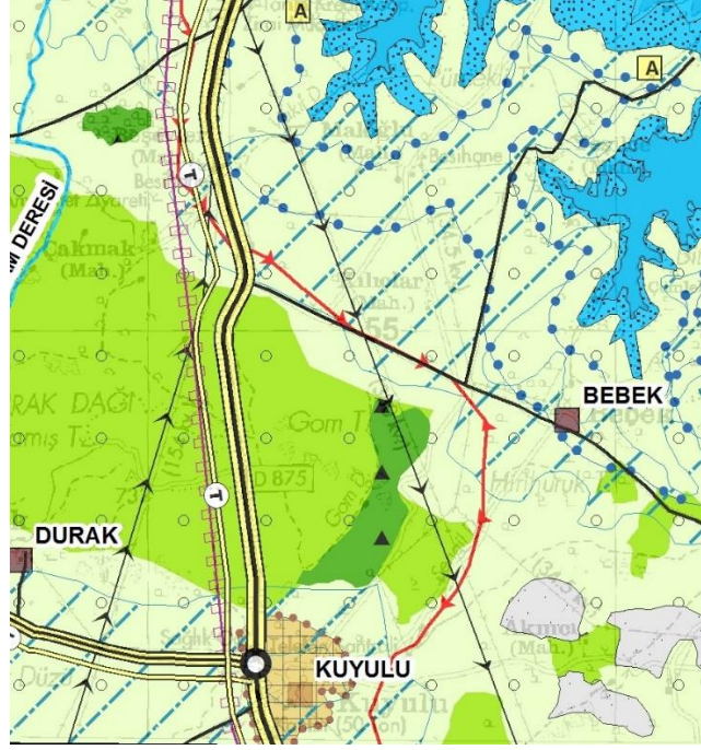
Adıyaman-Şanlıurfa-Diyarbakır Planlama Bölgesi 1/100.000 Ölçekli Çevre Düzeni Planı