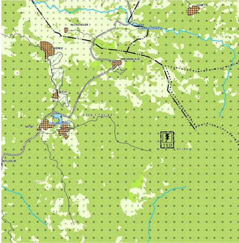
ÇDP Değişikliği Sonrası

Kıroba Elektrik Üretim A.Ş. vekili Şehir Plancısı Ahmet SALKIM'ın 09.02.2022 tarihli dilekçesi ile talep edilen Aydın İli, Çine İlçesi, Madranbaba Dağında mevcutta 10 türbin bulunan EPDK'nın 17.03.2010 tarih ve EÜ/2466-3/1601 Lisanslı Rüzgar Enerjisi Santrali bulunan alana 1 adet türbin daha eklenmesi amacıyla yenilenebilir enerji gösteriminin eklendiği M20 plan paftasını kapsayan Aydın-Muğla-Denizli Planlama Bölgesi 1/100.000 Ölçekli Çevre Düzeni Planı Değişikliği hazırlanmıştır.