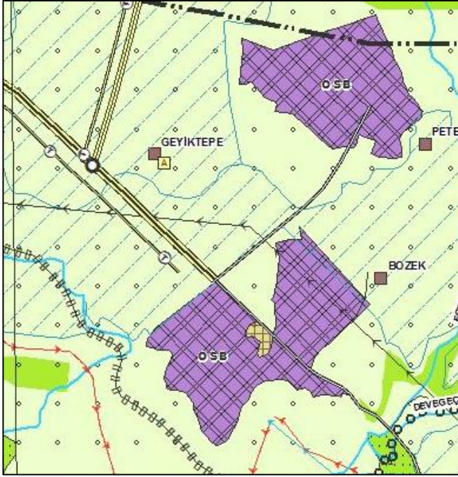
Adıyaman-Şanlıurfa-Diyarbakır Planlama Bölgesi 1/100.000 Ölçekli Çevre Düzeni Planı

Yapılan inceleme ve değerlendirme sonucunda; sanayi ürünlerinin depolanması amacıyla kullanılması öngörülen kentsel servis alanının konum olarak OSB'lere yakın, yerleşim alanlarına uzak ve ulaşım bağlantıları açısından elverişli bir noktada bulunması, doluluk oranının yüksek olduğu ifade edilen Diyarbakır Organize Sanayi Bölgesi içerisinde oluşan depolama alanı ihtiyacı dikkate alınarak, Diyarbakır İl Tarım ve Orman Müdürlüğü'nün 20.10.2021 tarihli ve 3093568 nolu görüşü ve Diyarbakır Büyükşehir Belediye Başkanlığı'nın 04.11.2021 tarihli ve 39851 sayılı görüşü ile ÇDP değişikliği yapılmasında sakınca olmadığı belirtilen 34 ha büyüklüğündeki alanın ÇDP'nin L-44 nolu paftasında "Kentsel Servis Alanı" olarak düzenlenmesi uygun bulunmuştur.