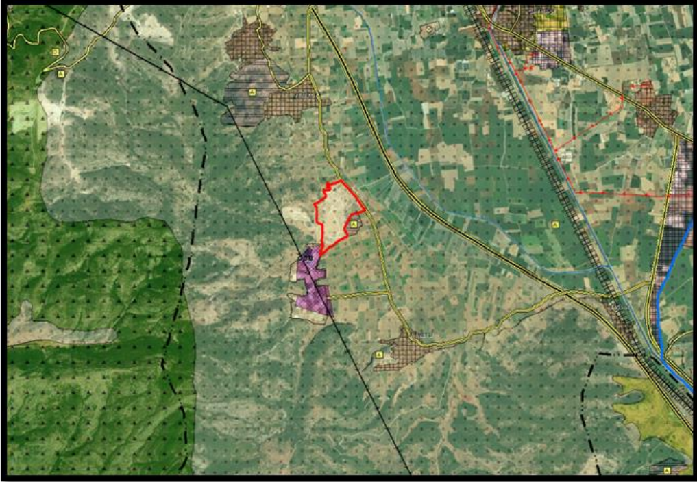
Şekil-1: İlave OSB Alanının İzmir-Manisa Planlama Bölgesi 1/100.000 Ölçekli Çevre Düzeni Planındaki Konumu

İzmir-Manisa Planlama Bölgesi 1/100.000 Ölçekli Çevre Düzeni Planının onayından sonra planlama bölgesi içerisinde yer seçimi kesinleşen organize sanayi bölgelerine ilişkin ÇDP'de "8.2.1.3. Organize sanayi bölgelerinde, OSB