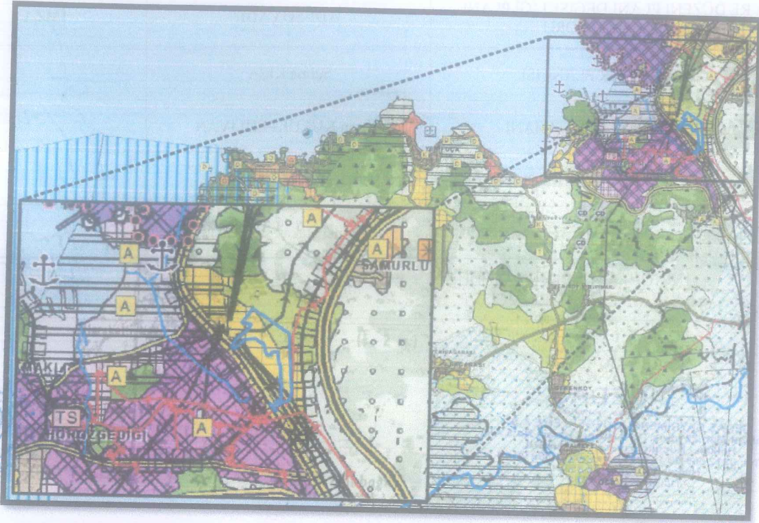
Harita 1: İzmir-Manisa Planlama Bölgesi 1/100.000 Ölçekli Çevre Düzeni Planı

yapılan alanda mera vasfı kalmadığından 1/100.000 ölçekli Çevre Düzeni Planında da buna uygun değişiklik yapılmıştır.