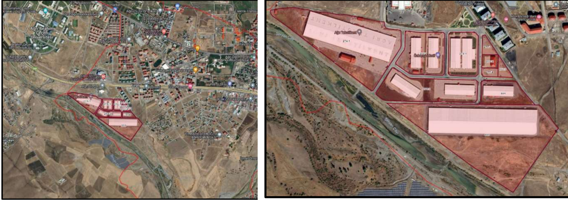
Plan Değişikliğine Konu Alanın Uydu Görüntüsü

Ağrı İli, Merkez İlçe, Suçatağı Mahallesi 274 ada 1 parsel, 275 ada 1 parsel, 276 ada 1 parsel, 277 ada 1,2,3,4 parseller, 278 ada 1 parsel, 0 ada 994 parsel, 0 ada 999 parsel numaralı taşınmazların Ardahan Kars İğdır Ağrı Planlama Bölgesi 1/100.000 Ölçekli ÇDP'nin I49 ve I50 no.lu plan paftalarına "Sanayi ve Depolama Bölgesi" olarak gösterilmesine yönelik düzenleme yapılmıştır.