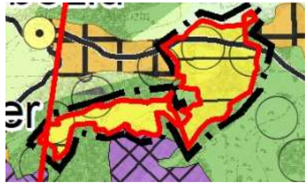
1/100.000 Ölçekli Revizyon ÇDP Değişikliği

Bununla birlikte, ÇDP'de, alt ölçekli planlama çalışmalarını ve uygulamaları yönlendirmek amacıyla; Osmaniye İli 1/100.000 ölçekli Revizyon Çevre Düzeni Planı'nda “7.15. Alt ölçekli planların hazırlanması aşamasında, ilgili kurum ve kuruluşların görüşlerinin alınması, afet riskinin (deprem, sel, heyelan gibi) değerlendirilmesi ve plan ölçeğinin gerektirdiği detayda mevzuata uygun jeolojik/jeoteknik etütlerinin yapılması zorunludur” hükmü yer almaktadır.