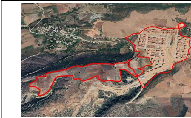
Osmaniye Düziçi Alibozlu İskân Alanı Sınırı