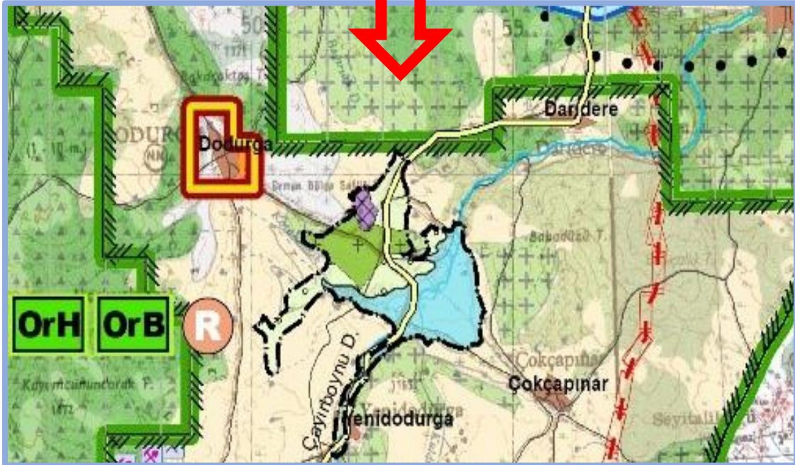
“Bilecik İli 1/100.000 ölçekli Çevre Düzeni Planı Değişikliği”