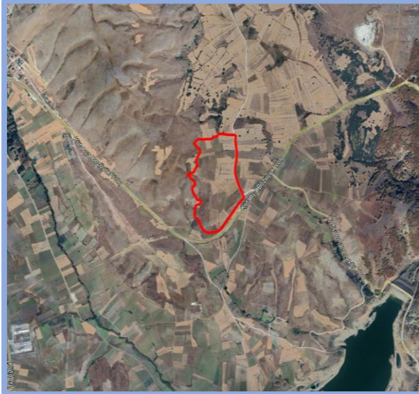
Sanayi ve Depolama Bölgesi- Uydu Görüntüsü

Planlamaya konu 7209, 7210, 7211, 7214, 7215, 7216, 7217, 7218, 7219, 7220, 7221, 7222, 7223, 7224, 7225, 7226, 7227, 7228, 7229, 7230, 7231, 7232, 7233, 7234, 7235, 7236, 7237, 7238, 7239, 7240, 7241, 7242, 7243, 7244, 7245, 7246 parsellerin tarla vasfında ve özel özel mülkiyettedir.