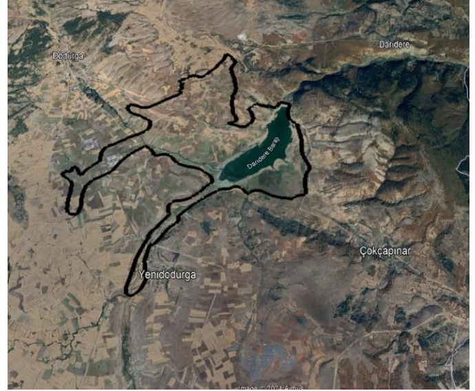
Planlama Alanı - Uydu Görüntüsü

Bilecik İli 1/100.000 ölçekli Çevre Düzeni Planında (ÇDP) söz konusu parsellerin hakim fonksiyon olarak "Tarım Alanı" nda, kısmen "Baraj ve Göletler Alanı" nda ve "Kırsal Gelişme Aksı" sınırları içerisinde kalmaktadır.