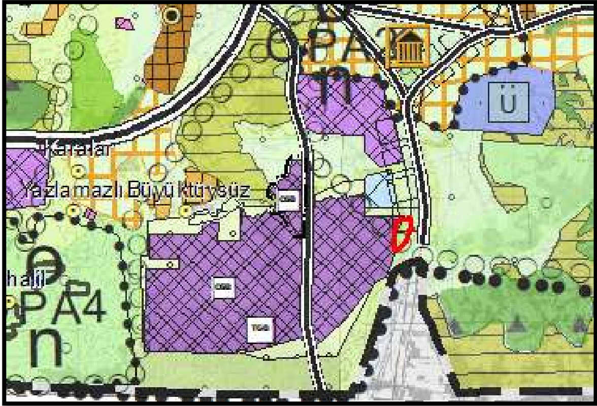
Osmaniye İli 1/100.000 ölçekli Revizyon Çevre Düzeni Planındaki yeri