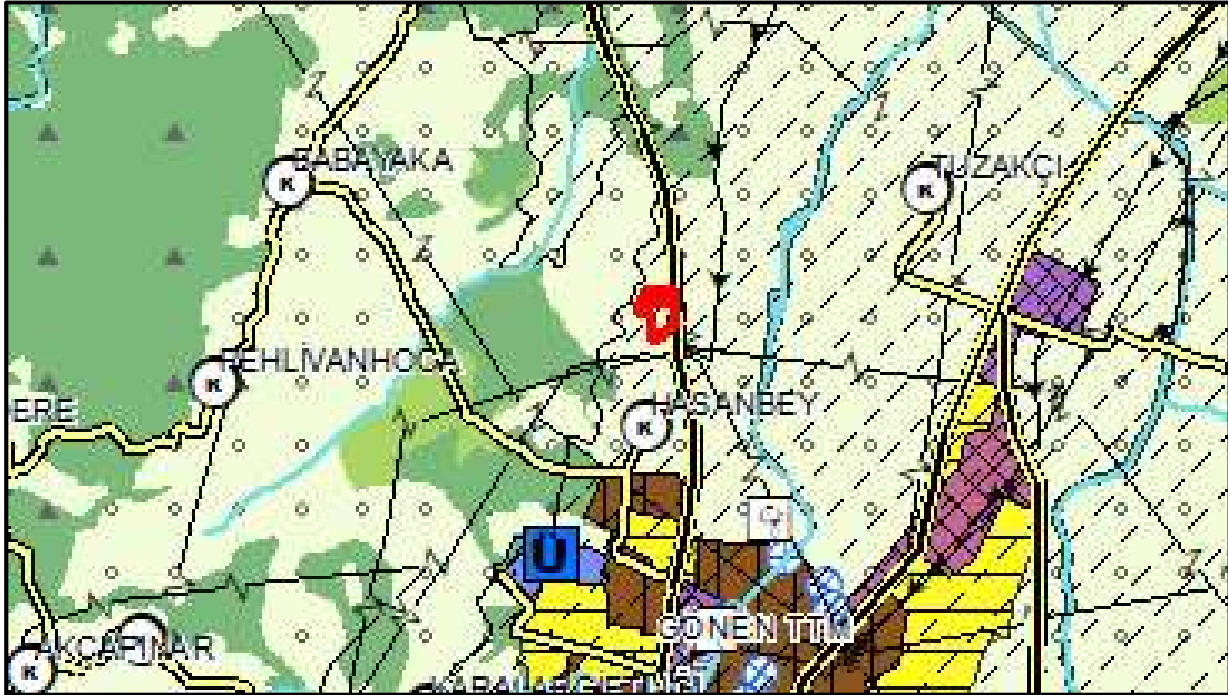
Balıkesir Çanakkale Planlama Bölgesi 1/100.000 ölçekli ÇDP'deki yeri

Yürürlükteki Balıkesir-Çanakkale Planlama Bölgesi 1/100.000 ölçekli Çevre Düzeni Planı (ÇDP)'nda talebe konu parseller “Tarım Alanı”nda ve “Sulama Alanı” sınırları içerisinde yer almaktadır.