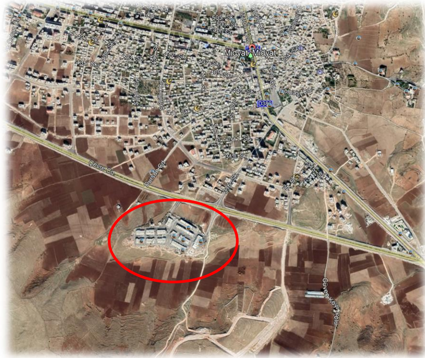
Planlama Alanının Konumu

Planlama Bölgesini oluşturan Mardin, Batman, Siirt, Şırnak ve Hakkâri İlleri; ülkemizin güneydoğusunda bulunmakta olup “Sosyo-Ekonomik Gelişmişlik Endeksi”nde tamamı Doğu ve Güneydoğu Anadolu bölgesindeki illerden oluşan “6. Kademe Gelişmiş İller Grubu”nda yer almaktadır. Altıncı kademede yer alan iller ekonomik ve sosyal göstergelerin önemli bir kısmı bakımından diğer kademelerde yer alan illere göre daha düşük değerler sergilemektedir. Grup, tarımsal üretimin gelişmişlik grupları arasında dağılımı itibariyle en son sırada bulunmaktadır.