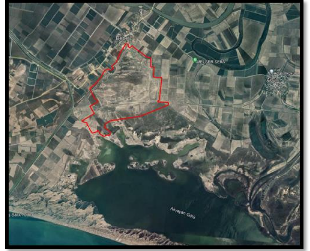
Mersin-Adana Planlama Bölgesi 1/100.000 Ölçekli Revizyon Çevre Düzeni Planı – Plan Değişikliği