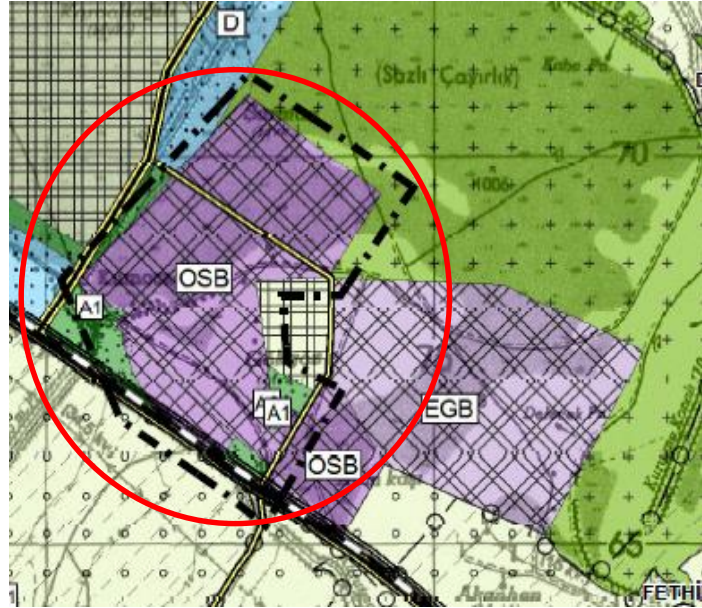
Konya-Karaman Planlama Bölgesi 1/100.000 Ölçekli Çevre Düzeni Planı Değişikliği

Sanayi ve Teknoloji Bakanlığı'nın 17.07.2018 tarihli ve E.2929 sayılı yazısı üzerine Konya Çumra OSB İlave Alanı, yürürlükte bulunan Konya-Karaman Planlama Bölgesi 1/100.000 Ölçekli Çevre Düzeni Planı M29 Plan Paftasına "Organize Sanayi Bölgesi" olarak gösterilmesine yönelik düzenleme yapılmıştır.