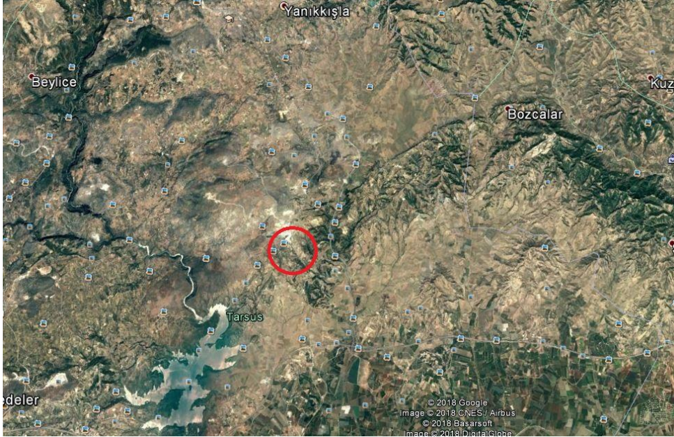
Şekil 1. Planlama Alanının Konumu (Uydu Görüntüsü)

Bilim, Sanayi ve Teknoloji Bakanlığınca yer seçimi yapılmış olan alan Mersin İli, Tarsus İlçesi, Kurbanlı Mahallesi, Evcı Deresi ve Kum Gedigi Mevkii'nde yer almakta olup yaklaşık 58 hektar büyüklüğündedir.