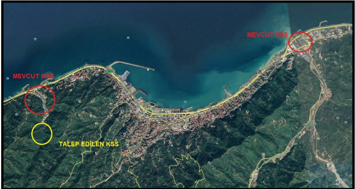
Şekil 1: Plan değişikliğine konu alanın konumu

Plan değişikliğine konu alan; Rize İli, Çiftekavak, Kanbursirt ve Hayrat Mahalleleri ve Uzunköy Köyü sınırları içerisinde, mevcut Küçük Sanayi Sitesi (KSS) alanının güneyinde yer almaktadır.