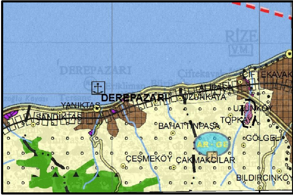
Şekil 4: 1/100.000 ölçekli ÇDP Değişikliği