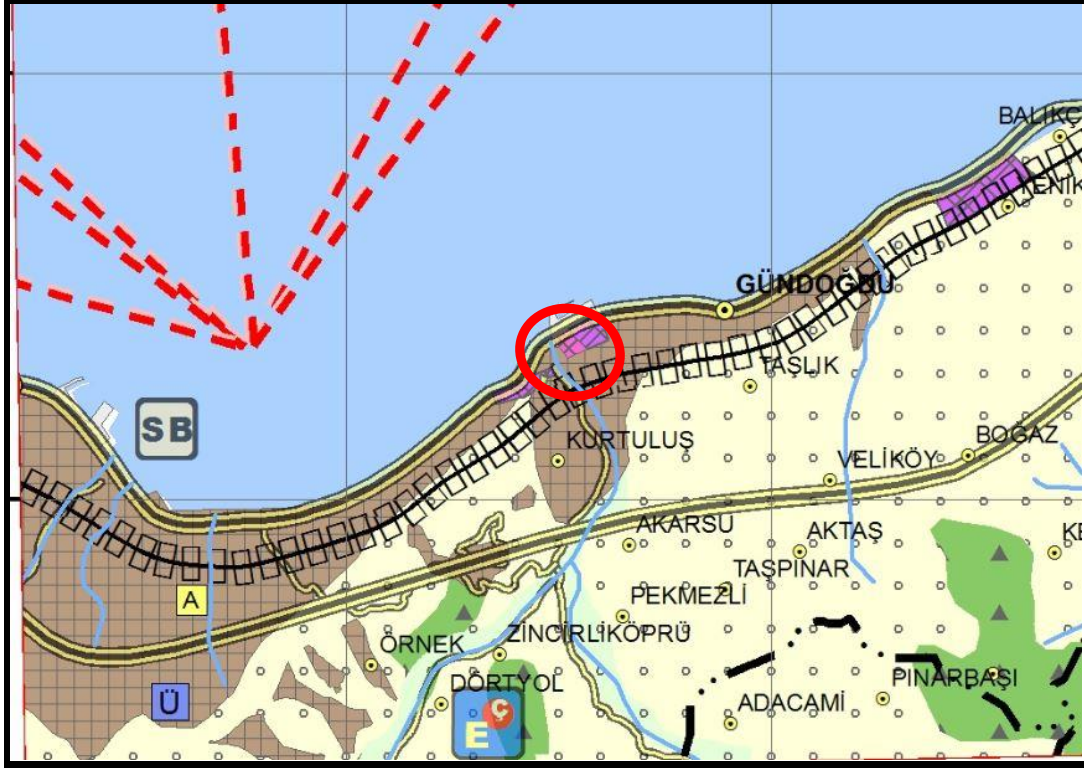
Şekil 2: Plan değişikliği öncesi 1/100.000 ölçekli ÇDP'deki durum.

Plan değişikliğine konu alan; Ordu-Trabzon-Rize-Giresun-Gümüşhane-Artvin Planlama Bölgesi 1/100.000 Ölçekli Çevre Düzeni Planı'nda F-45 Numaralı Plan Paftasında "Küçük Sanayi Sitesi" olarak tanımlanan alanda yer almaktadır.