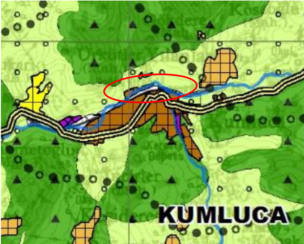
Şekil 3: Plan değişikliğine konu alanın 1/100.000 ölçekli ÇDP'deki yeri

Zonguldak-Bartın-Karabük Planlama Bölgesi 1/100.000 Ölçekli Çevre Düzeni Planı'nın F-28 Numaralı Plan Paftasında; ilave imar planına konu Toplu İşyeri Alanı "Kentsel Yerleşik Alan", Küçük Sanayi Alanının bir kısmı "Kentsel Yerleşik Alan", bir kısmının ise "Tarım Arazisi", Tarım ve Hayvancılık Tesis Alanı ile çevresindeki Ticaret ve Park Alanları da "Tarım Arazisi" olarak tanımlanan alanda yer almaktadır.