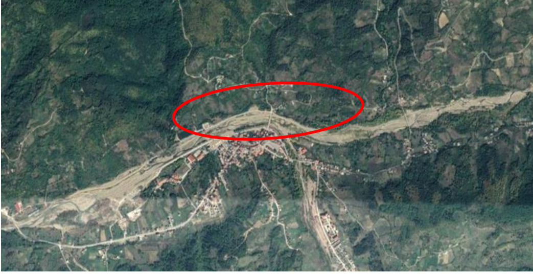
Şekil 2: Plan değişikliğine konu alanın konumu

Plan değişikliğine konu alan; Bartın İli, Ulus İlçesi, Kumluca Beldesi sınırları içerisinde 162-163-167-174 adalar üzerinde yer almaktadır.