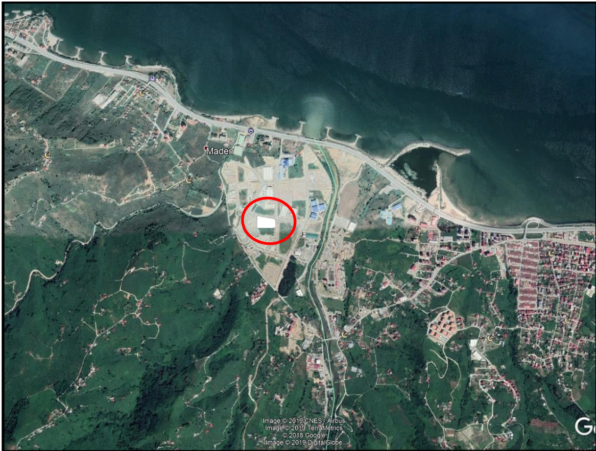
Şekil 1: Plan değişikliğine konu alanın konumu

Plan değişikliğine konu alan; Giresun İli, Bulancak İlçesi sınırlarında Organize Sanayi Bölgesi olarak tanımlanan alan içerisinde yer almaktadır.