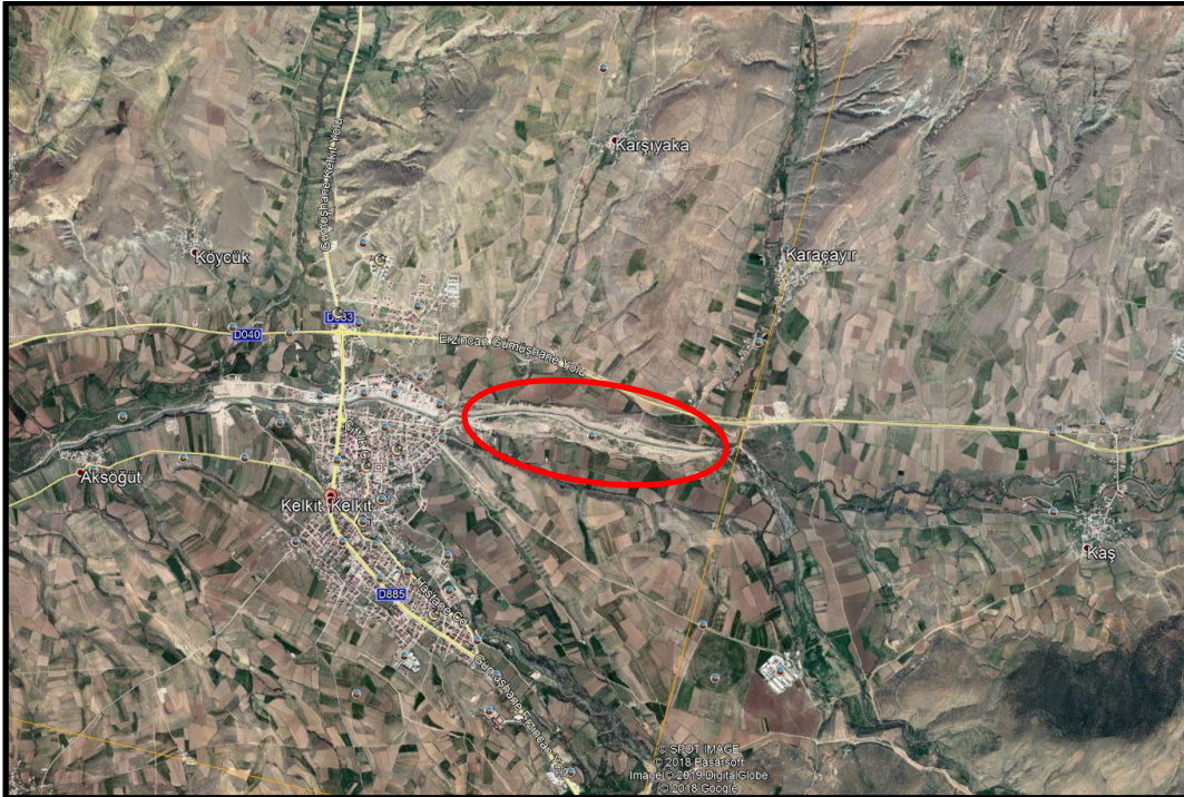
Şekil 1: Plan değişikliğine konu alanın konumu

Plan değişikliğine konu alan; Gümüşhane İli, Kelkit İlçesi sınırları içerisinde, yerleşimin doğusunda yer almaktadır.