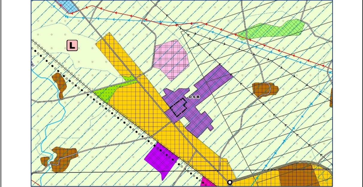
Adiyaman-Şanlıurfa-Diyarbakır Planlama Bölgesi 1/100.000 Ölçekli Çevre Düzeni Planı Değişikliği