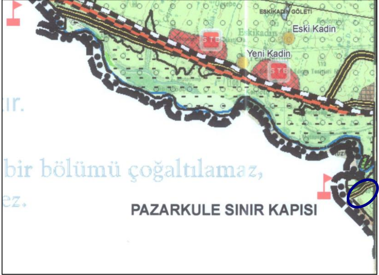
Şekil 5: Planlama Alanı- Trakya Alt Bölgesi Ergene Havzası 1/100.000 ölçekli Revizyon Çevre Düzeni Planı (E16 no'lu Plan Paftası)

Planlama alanı, bir alt kademede Edirne İli 1/25.000 ölçekli Çevre Düzeni Planı'nda "Tarımsal Açıdan Birinci Öncelikli (Mutlak) Korunacak Alan" olarak tanımlanan alanda yer almakta, bölgede Pazarkule Sınır Kapısı'nın gösterildiği "Sınır Kapısı" fonksiyonu/sembolü bulunmakta, ayrıca "Askeri Güvenlik ve Yasak Bölge" kapsamında bulunmaktadır (Şekil 6).