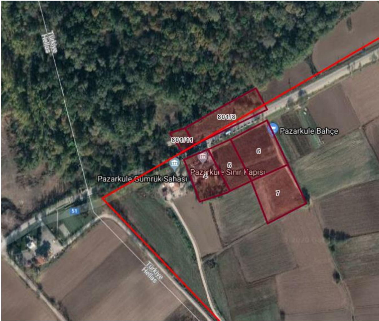
Şekil 1: Planlama Alanı-Uydu Görüntüsü

Türkiye ile Yunanistan arasında yolcu ve araç geçişinin sağlandığı; Ticaret Bakanlığı-Trakya Gümrük ve Dış Ticaret Bölge Müdürlüğü bağlantısındaki Pazarkule Gümrük Kapısı'nda, daha etkin ve hızlı gümrük hizmetleri sunulabilmesi için Gümrük Kapısının Modernizasyonu kapsamında ilave gümrük sahasına ihtiyaç duyulmuş olup 4 no'lu Parselde bulunan mevcut Gümrük Alanı ile bu alana ilave 5-6-7 Parseller ve 801 Ada 8-11 Parsellerde imar planının genişletme çalışmaları yapılmak suretiyle “Yeni Pazarkule Gümrük Kapısı” yapılması planlanmaktadır.