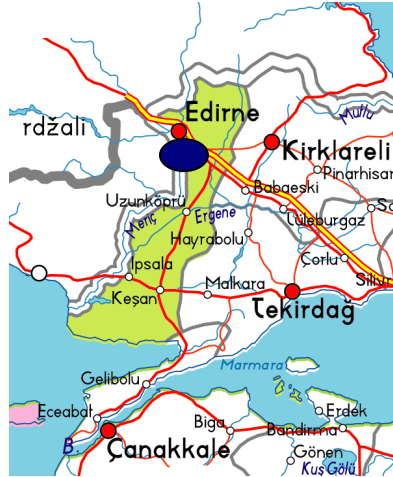
Şekil 3: Planlama Alanı-Edirne İlindeki Konumu

Bu kapsamda hazırlanacak alt ölçek planlar için; Edirne İli 1/25.000 ölçekli Çevre Düzeni Planı-Plan Hükümlerinin 2.58. nolu maddesi gereği, söz konusu alanın 1/25.000 ölçekli Çevre Düzeni Planı'nda Gümrük Alanı olarak düzenlenmesi gerekmektedir.