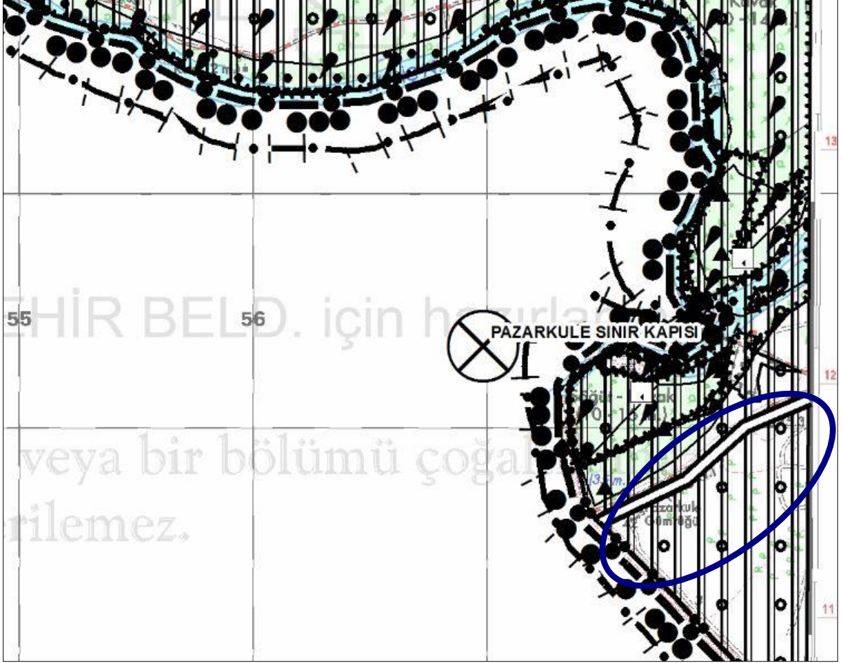
Şekil 6: Planlama Alanı-Edirne İli 1/25.000 ölçekli Çevre Düzeni Planı (E16-c2 no'lu Plan Paftası)

Edirne İli 1/25.000 Ölçekli Çevre Düzeni Planı-Plan Hükümlerinin;