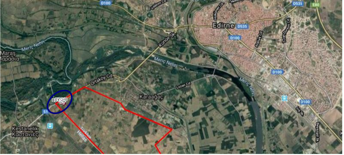
Şekil 2: Planlama Alanı-Merkez İlçesi Karaağaç Mahallesi'ndeki Konumu