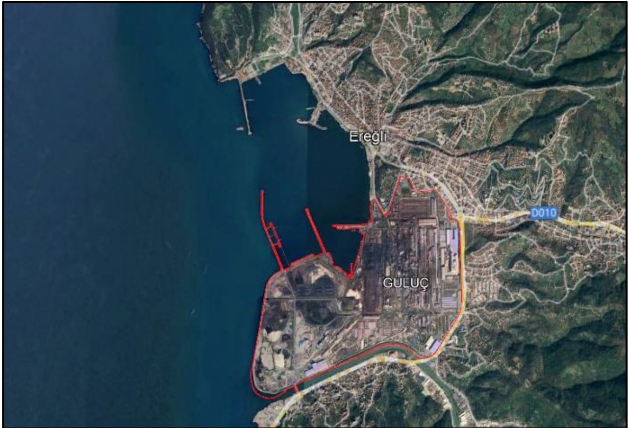
Şekil 1: Plan değişikliğine konu alanın konumu

Planlama alanın içerisinde ve yakın çevresinde tarım alanı, orman alanı rekreasyon alanı, turistik öge, peyzaj değeri yüksek olan herhangi bir alan bulunmamaktadır. ERDEMİR yerleşkesi içinde kalan alanda Fabrika ve İmalat kullanımları en geniş alanı kaplamakta olup batı kesimde yine ERDEMİR'e ait liman ve liman geri sahası, alanın güneybatı ucunda ise depolama ve ambar tesisleri bulunmaktadır.