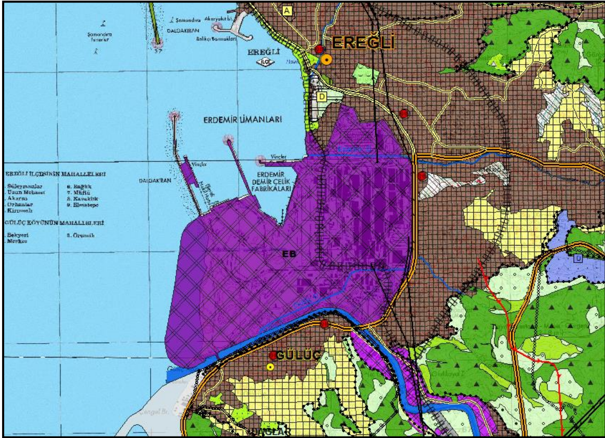
Şekil 5: 1/25.000 ölçekli Çevre Düzeni Planı Değişikliği