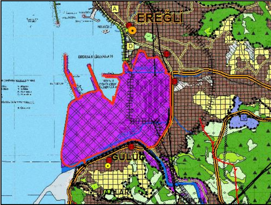
Şekil 3: Plan değişikliğine konu alanın 1/25.000 ölçekli ÇDP'deki yeri