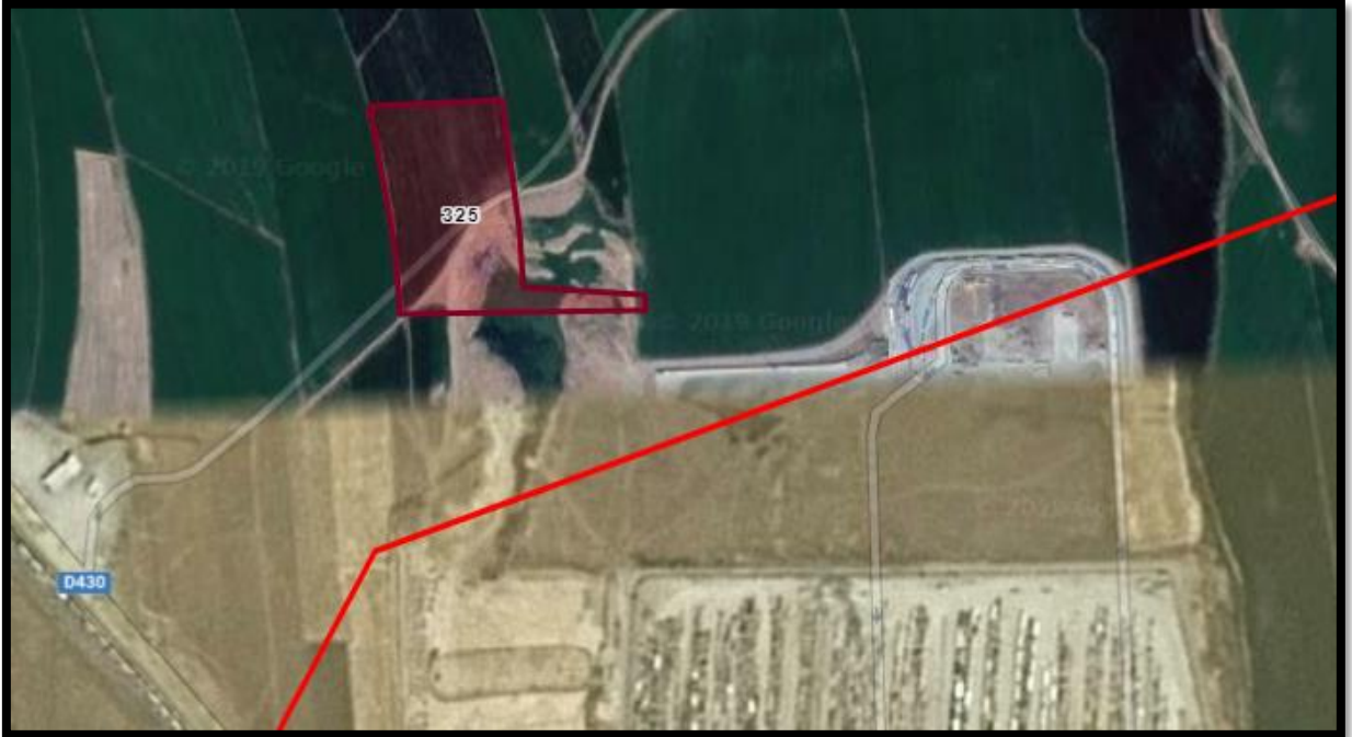
Şekil 1: Plan değişikliğine konu alanın konumu

Plan değişikliğine konu alan Şırnak ili, Silopi ilçesi, Başverimli Beldesi, 325 parsel no'lu taşınmazı kapsamaktadır.