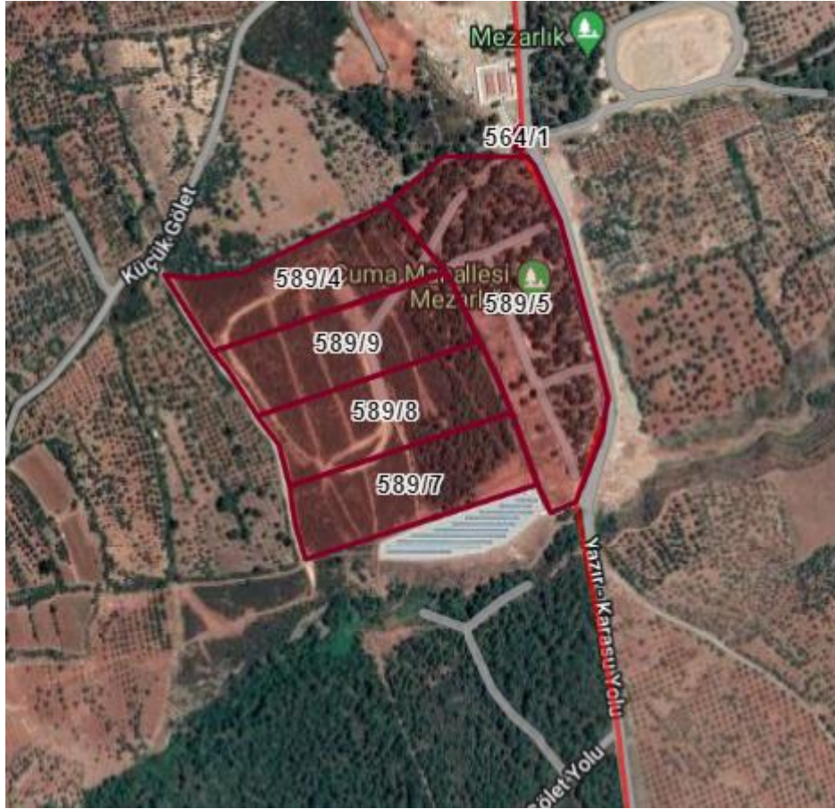
Talebe Konu Parseller