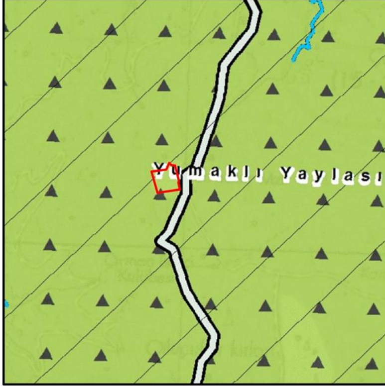
Talebe konu alanın ÇDP'deki durumu

Talebe konu alanın Aydın-Muğla-Denizli Planlama Bölgesi 1/100.000 Ölçekli Çevre Düzeni Planı'nda (ÇDP) arazi kullanım kararları bakımından "orman alanı" ve "önemli doğa alanı" olarak tanımlı alanlarda kaldığı bununla birlikte tapuda tarla vasfı ile kayıtlı olduğu belirlenmiştir.