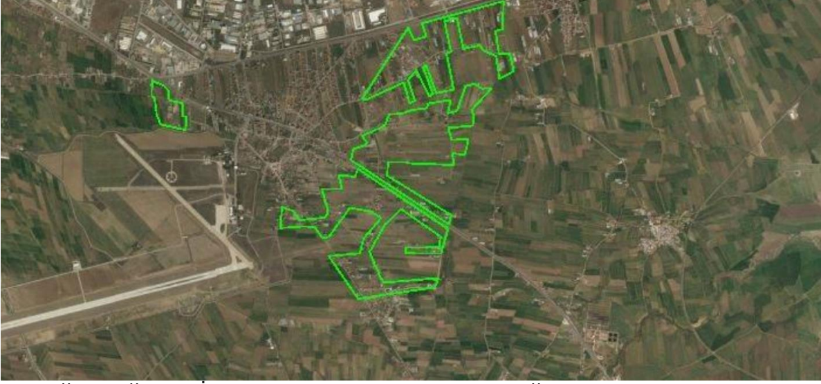
Elazığ Valiliği'nin (İl Gıda Tarım ve Orman Müdürlüğü) 11 Ekim 2016 tarihli ve 230.04.02-706 sayılı yazısı ile uygun görüş verilen alanlar

Bu çerçevede planlar arası kademeli birlikteliğin sağlanması amacıyla Elazığ Valiliği'nin (İl Gıda Tarım ve Orman Müdürlüğü) 11 Ekim 2016 tarihli ve 230.04.02-706 sayılı yazısı ile uygun görüş verilen alanlardan halihazırda yapılaşmanın bulunduğu alanların "kentsel yerleşik alan"; yapılaşmamış alanların ise "kentsel gelişme alanı" olarak düzenlendiği Malatya-Elazığ-Bingöl-Tunceli Planlama Bölgesi 1/100.000 ölçekli Çevre Düzeni Planı Değişikliği hazırlanmıştır.