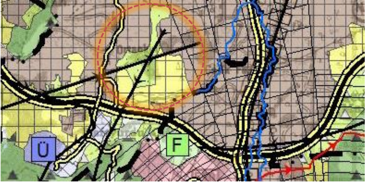
Harita 1: Mevcut Durum (Kısmi İptal Olan 1/100.000 Ölçekli Çevre Düzeni Planı)

İmar planının meri olduğu süreçte edinilen kazanılmış hakların da bulunduğu göz önüne alındığında dava konusu alandaki “Bölge Parkı, Büyük Kentsel Yeşil Alan” kullanımının ÇDP değişikliği öncesindeki haline aynı şekilde döndürülmesinin alandaki fiziki gerçekleştirmeler bakımından teknik olarak ve müktesep haklar açısından hukuki olarak olanaklı olmadığı değerlendirilmektedir. Buna karşın 2577 sayılı Kanun uyarınca yargı kararlarına uygun olarak idarelerce işlem tesis edilmesi gerekliliği çerçevesinde; alanda “Kentsel Gelişme Alanı” kararı verilemeyeceği, fiziki gerçekleştirmelere ve uygulamalara konu alanların genel hatlarıyla “Kentsel Yerleşik Alan” olarak düzenlenebileceği sonucuna varılmıştır.