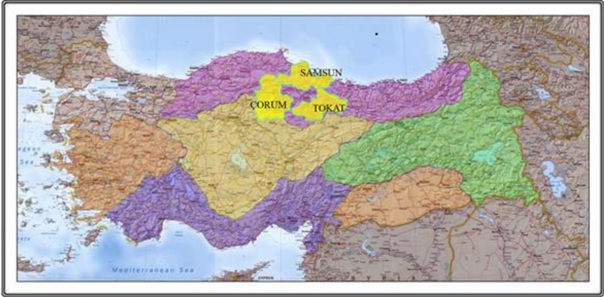
Şekil 1: Samsun-Çorum-Tokat Planlama Bölgesi

Samsun-Çorum-Tokat Planlama Bölgesi 1/100.000 Ölçekli Çevre Düzeni Planı Samsun, Çorum, Tokat il sınırları içinde, planın amacına yönelik mekânsal kararlar, politika ve stratejileri içermektedir. İllerin yönetsel sınırları bu planın onay sınırlarıdır. Planlama Bölgesi toplam 37.762 km 2 'lik bir alanı kapsamaktadır.