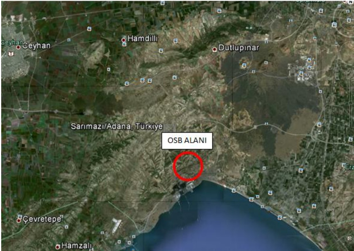
Şekil 1. Planlama Alanının Konumu (Uydu Görüntüsü)

Bilim, Sanayi ve Teknoloji Bakanlığınca yer seçimi yapılmış Ceyhan Organize Sanayi Bölgesi (bundan sonraki bölümlerde "planlama alanı" olarak yer alacaktır) Adana İli, Ceyhan İlçesi, Sarımaçı Mahallesi, Şarlayan Tepe ve Başyurt Mevkiilerinde yer almakta olup yaklaşık 121 ha. büyüklüğündedir. Alanda mülkiyet durumu, bir bölümü tapulama dışı alan olmak üzere kamu ve özel şahıslar olarak yer almaktadır.