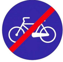
MECBURİ BİSİKLET YOLU SONU