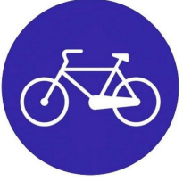
MECBURİ BİSİKLET YOLU