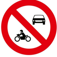
MOTORLU TAŞIT GİREMEZ