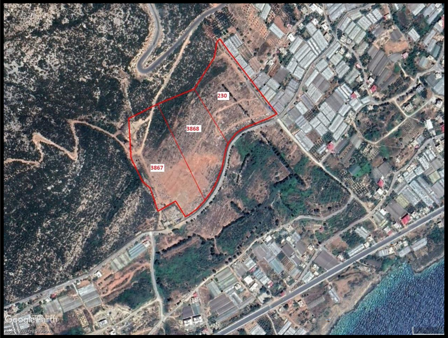
Resim 1: Planlama Alanı Uydu Görüntüsü

Plan deęişikliğine konu alan Mersin İli, Aydıncık İlçesi, Aydıncık(Atatürk) Mahallesinde, Maliye Hazinesi mülkiyetinde bulunan toplam yaklaşık 6,37 ha büyüklüğündeki 230, 3867, 3868 nolu parsellerin yaklaşık 4,94 hektarlık kısmını kapsamaktadır. Söz konusu alan Y:528027-527670, X:4001437-4001045 koordinatları arasında 1/5000 ölçekli P30-C-12-A nolu halihazır haritada kalmaktadır.