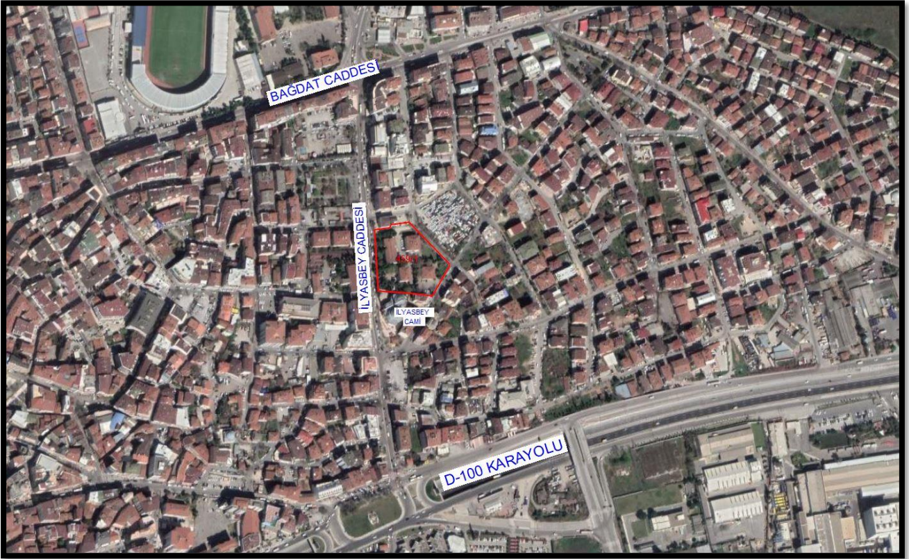
459 ada 1 parsel konumu

Plan değişikliğine konu alan Gebze'nin en önemli arterlerinden birisi olan İlyasbey Caddesi üzerinde, en önemli camilerinden birisi olan İlyasbey Caminin kuzeyinde kalmaktadır.