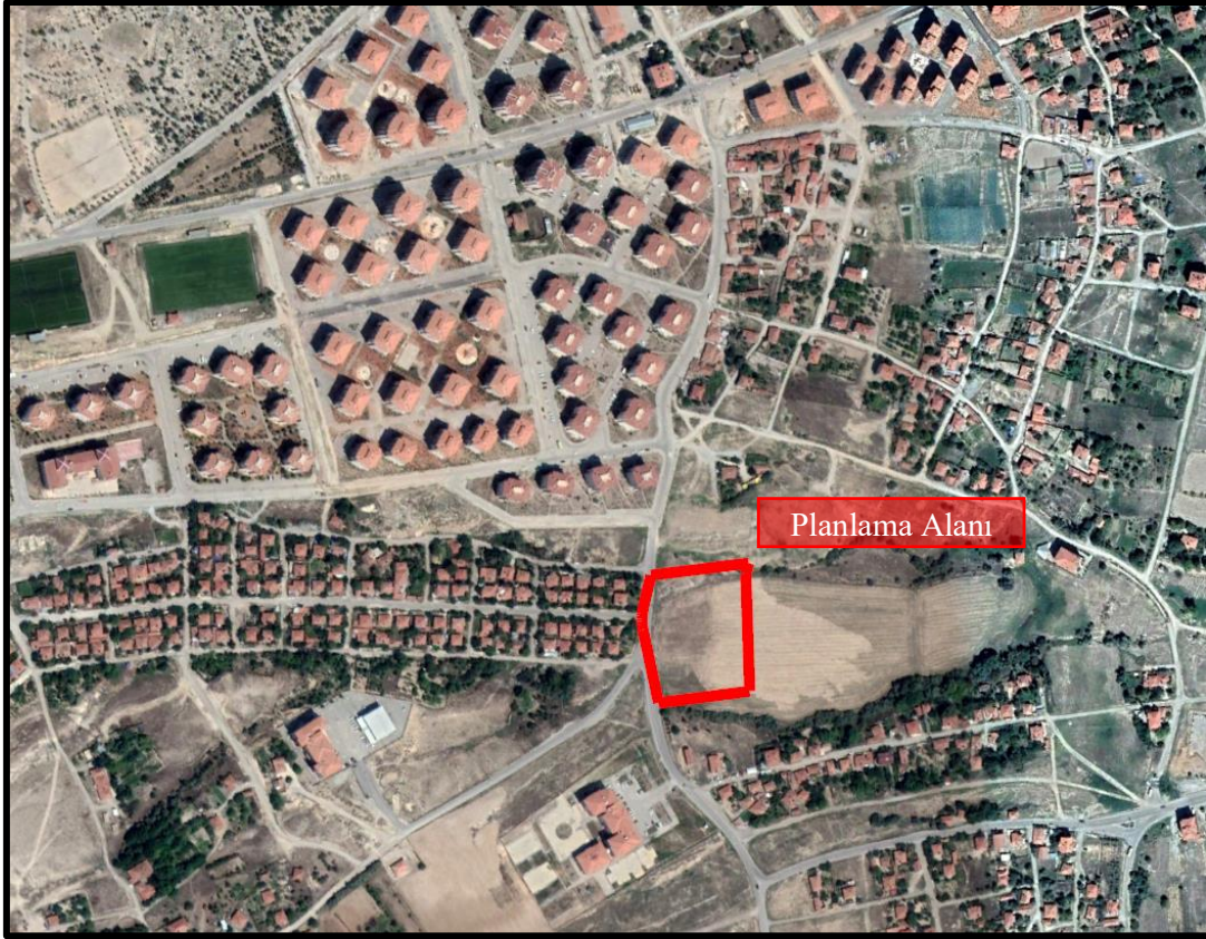
Şekil 3. İmar Planına Konu Alana Ait Yakın Uydu Görüntüsü

Planlamaya konu 4592 ada 1 parsel no.lu taşınmaz üzerinde halihazırda herhangi bir yapı veya kullanım bulunmamaktadır.