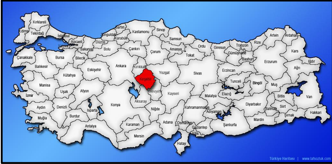
Şekil 1. Kırşehir İlinin Ülke İçerisindeki Konumu

Planlama alanı; Kırşehir ili, Merkez ilçesi, Kayabaşı mahallesi, 4592 ada 1 parseli kapsamaktadır. Konu taşınmaz, il merkezinin batı kesiminde kent çeperinde kalmaktadır. Kent merkezinde yeni gelişme alanı olarak gözlemlenmekte olup toplu konut bölgesi yakınlarında ve yapılaşmayı henüz tamamlamamış bir bölgedir.