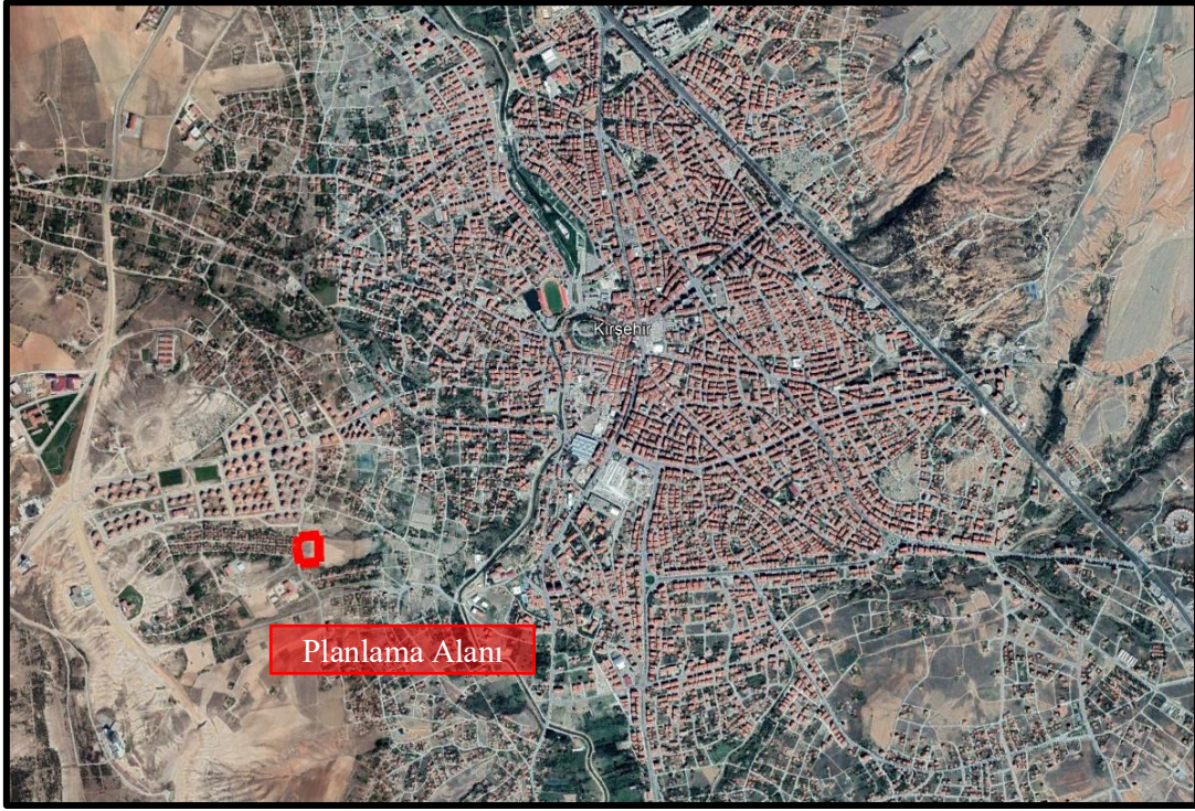
Şekil 2. Planlama Alanının Kent İçerisindeki Konumu