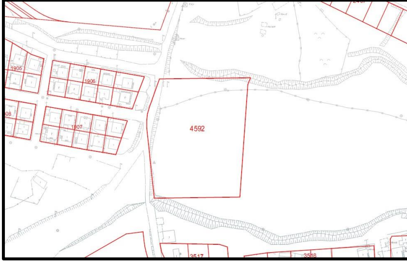
Şekil 4. Planlama Alanının Halihazır ve Mülkiyet Durumu

Planlama alanı Kırşehir ili, Merkez ilçesi, Kayabaşı mahallesi sınırları içerisinde yer alan 4592 Ada 1 Nolu parsel sınırından oluşmaktadır. Plan değişikliğine konu parsel alanının TKGM sistemine göre toplam büyüklüğü 11.761,00 m 2 'dir. Plan değişikliğine konu alan ise 4592/1 parselin 10.075,84 m 2 'si ve yaklaşık tescil harici alanın 141 m 2 'sinden oluşmakta olup toplam 10.216,84 m 2 'dir. Parselin mülkiyeti Maliye Hazinesi üzerinde olup Jandarma Genel Komutanlığı (İçişleri Bakanlığı) tahsis edilmiş iken anılan protokol kapsamında "Rezerv Yapı Alanı" olarak belirlendiğinden tahsisi Altyapı ve Kentsel Dönüşüm Genel Müdürlüğü'ne geçmiştir.