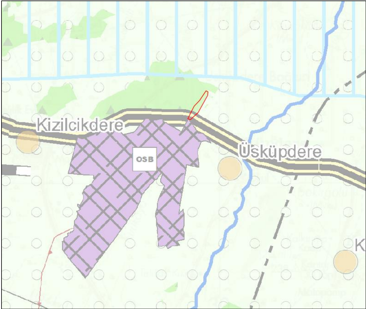
Şekil 4 Planlama Alanının Trakya Alt Bölgesi Ergene Havzası 1/100.000 Ölçekli Revizyon ÇDP'deki Durumu

Plan değişikliğine konu Kırklareli İli, Merkez İlçe, Kızılcıkdere Köyünde yer alan 0 ada 3591 parsel numaralı taşınmaz; 24.08.2009 onay tarihli Trakya Alt Bölgesi Ergene Havzası 1/100.000 Ölçekli Revizyon Çevre Düzeni Planı'nda (E 18 plan paftasında) hakim fonksiyon olarak "Orman Alanı"nda kalmaktadır.