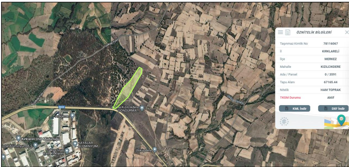
Şekil 1 Planlama Alanının Konumu