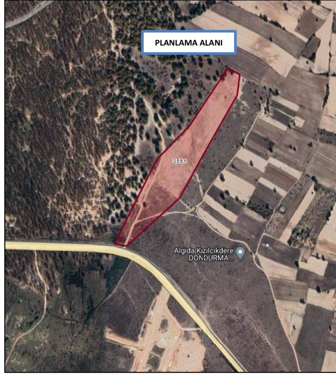
Şekil 2 Planlama Alanının Yakın Konumu

Planlama alanı D-020 Karayolu Eski İstanbul-Kırklareli-Pınarhisar Yolu bölümüne komşu olup, Avrupa E-87 Yolu D-555 Karayolu'na 10 km mesafede bulunmaktadır.