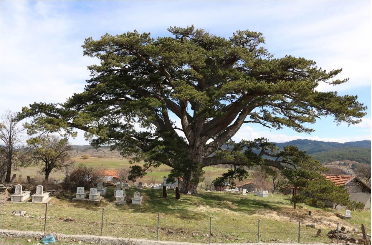
Araç İlçesi, Bektüre Köyü, Anadolu Karaçamı, tahmini yaşı (800)