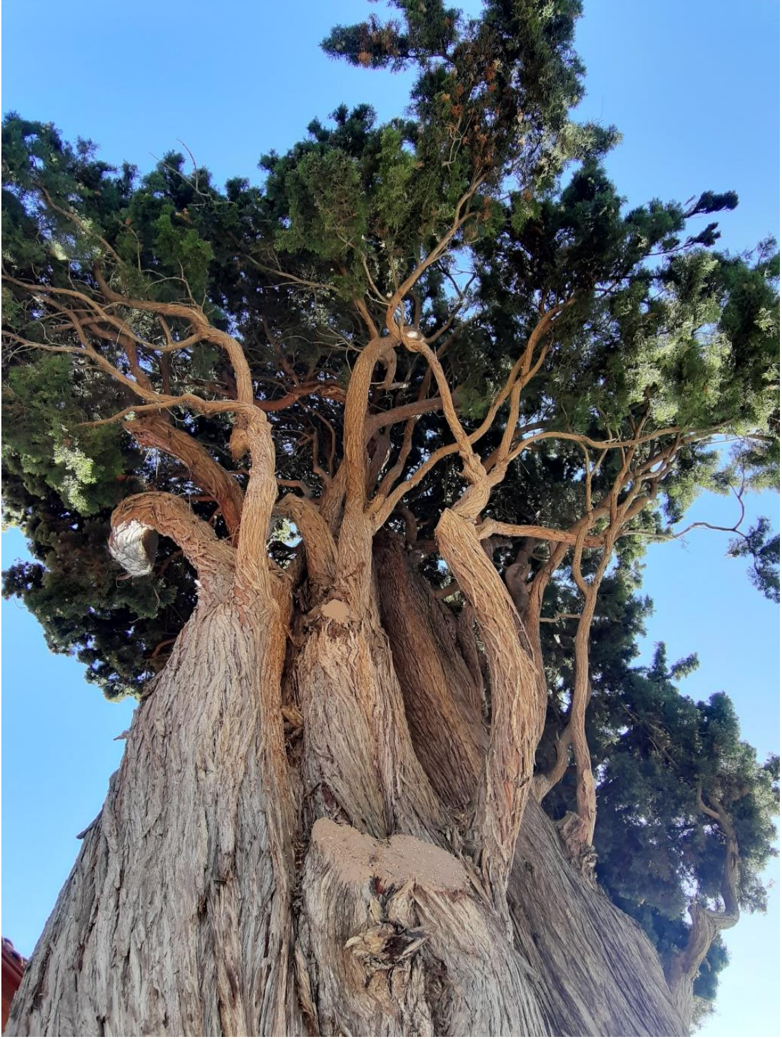
Çatalzeytin İlesi, Çağlar Köyü, Servi Ağacı, tahmini yaşı (420)