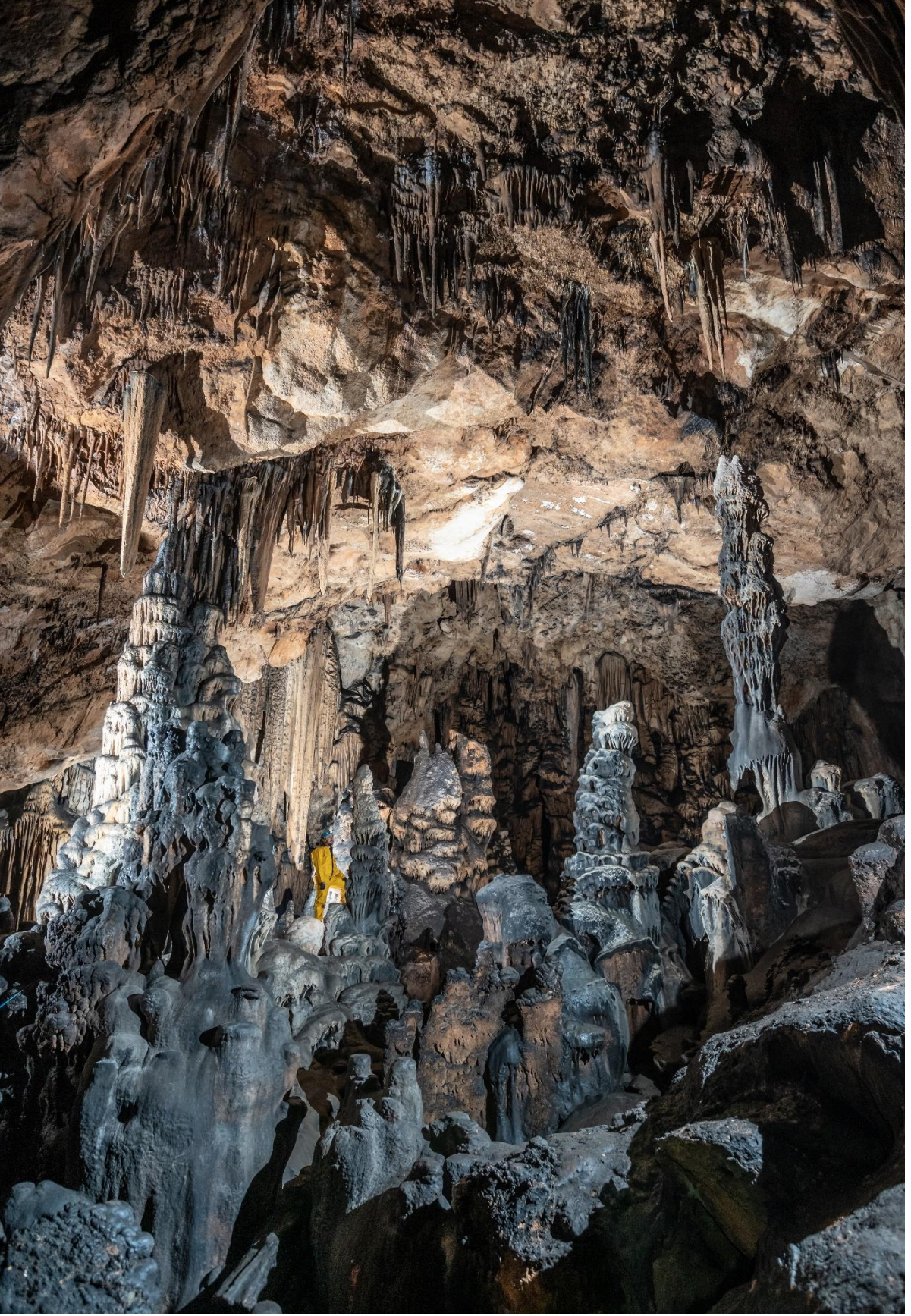
Devrekani İlçesi, Gizemli (sisli) Mağarası