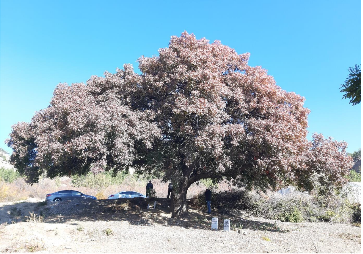
Tosya İlçesi, Merkez, Menengiç Ağacı tahmini yaşı (150)