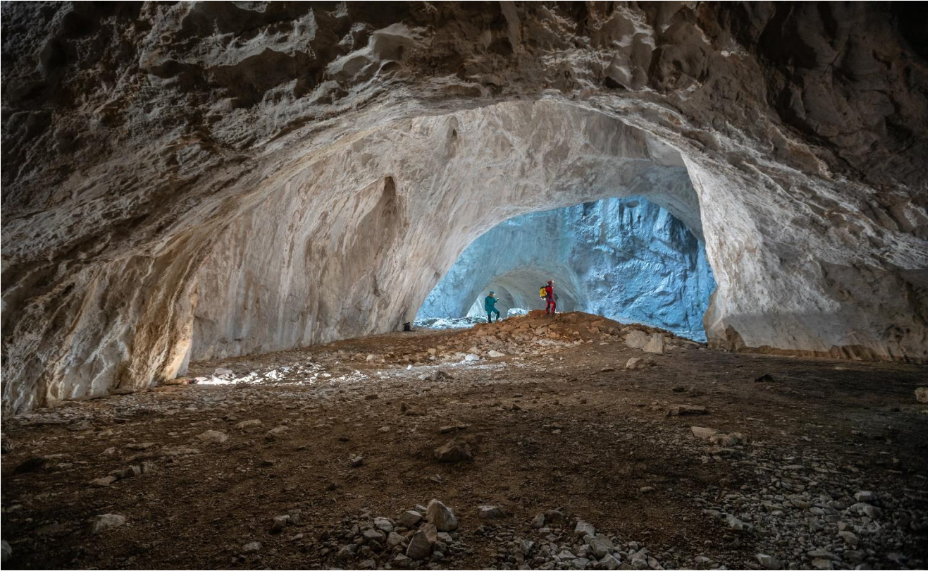
Pınarbaşı İlçesi, Ilgarini Mağarası