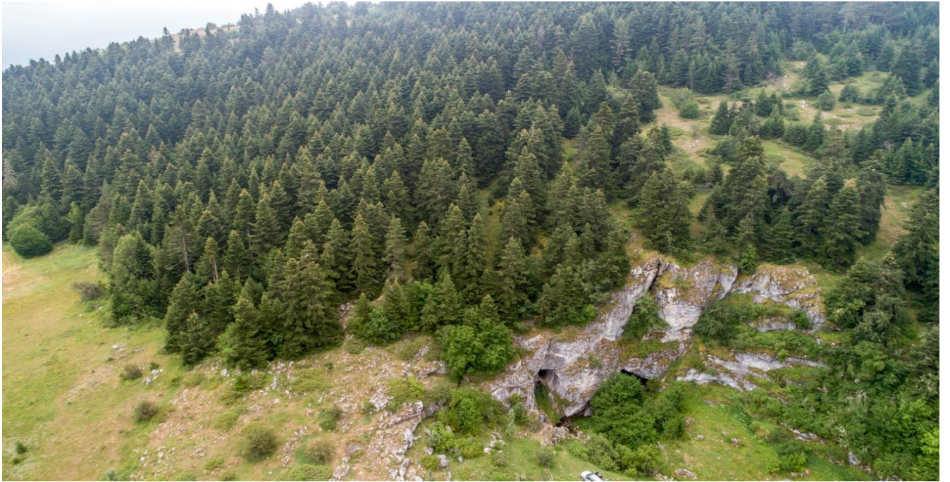
Devrekani İlçesi, Sarpunalinca Mağarası