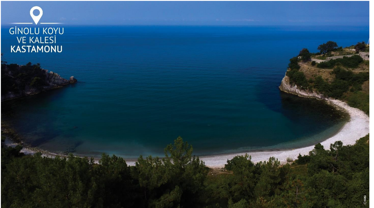
Çatalzeytin İlçesi, Ginolu Koyu