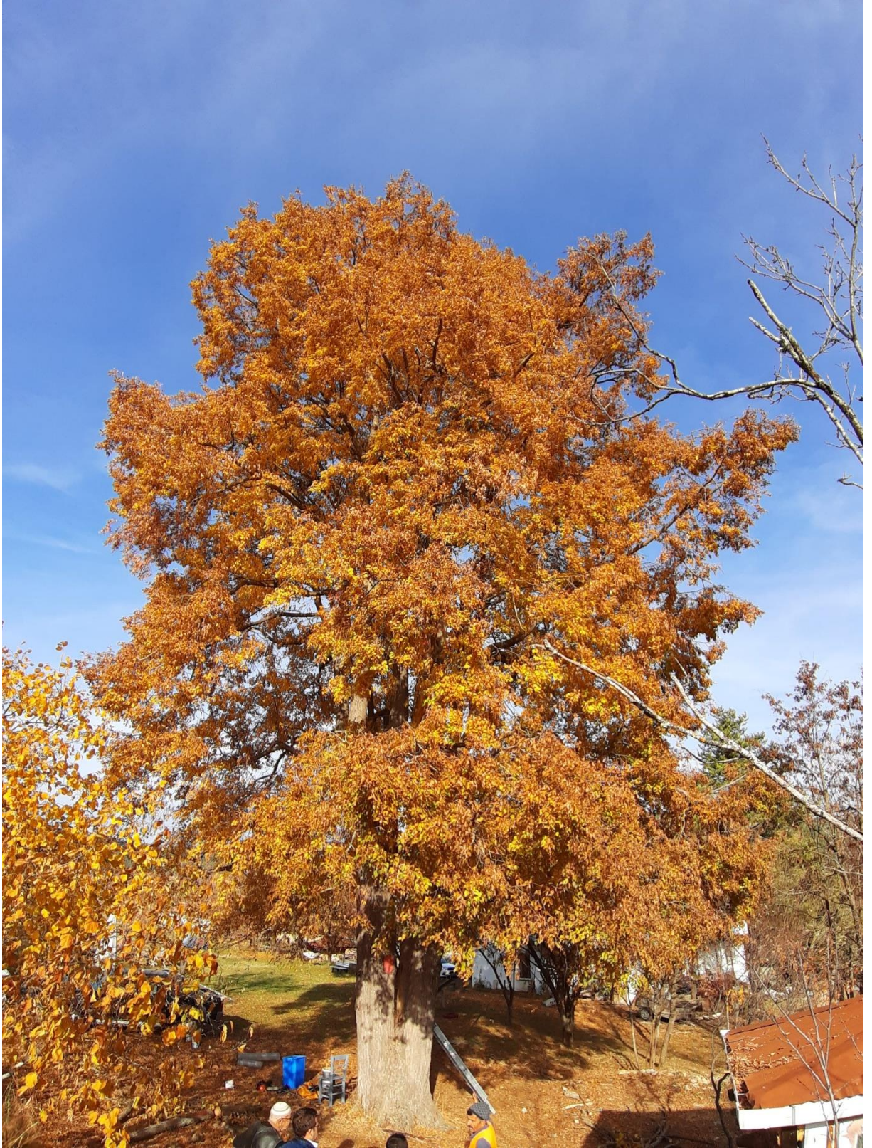
Daday İlçesi, İnceğiz Köyü, İhlamur Ağacı, tahmini yaşı (200)