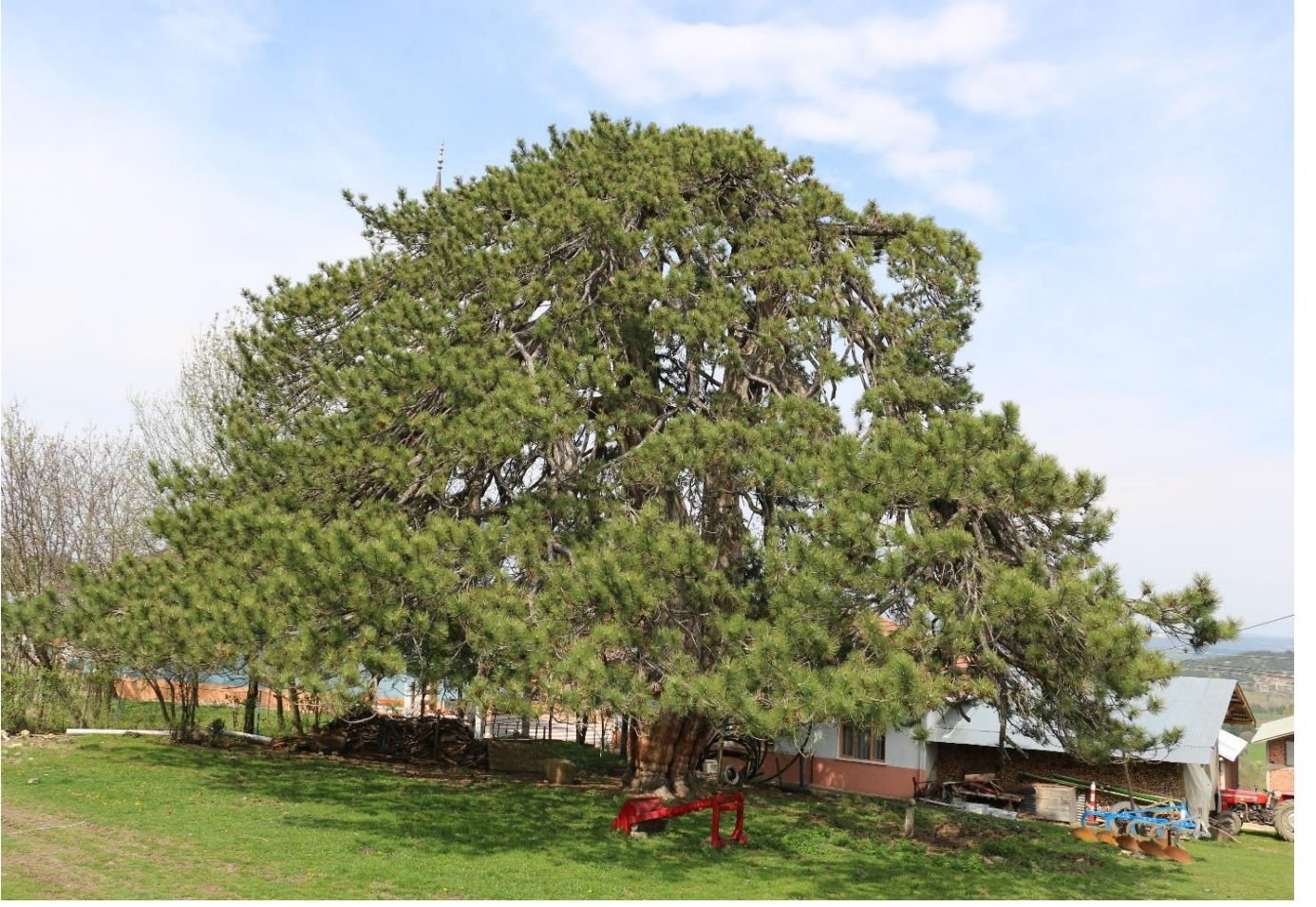
Kastamonu Merkez Kıyık Köyü, am Ađacı, tahmini yaşı (860)