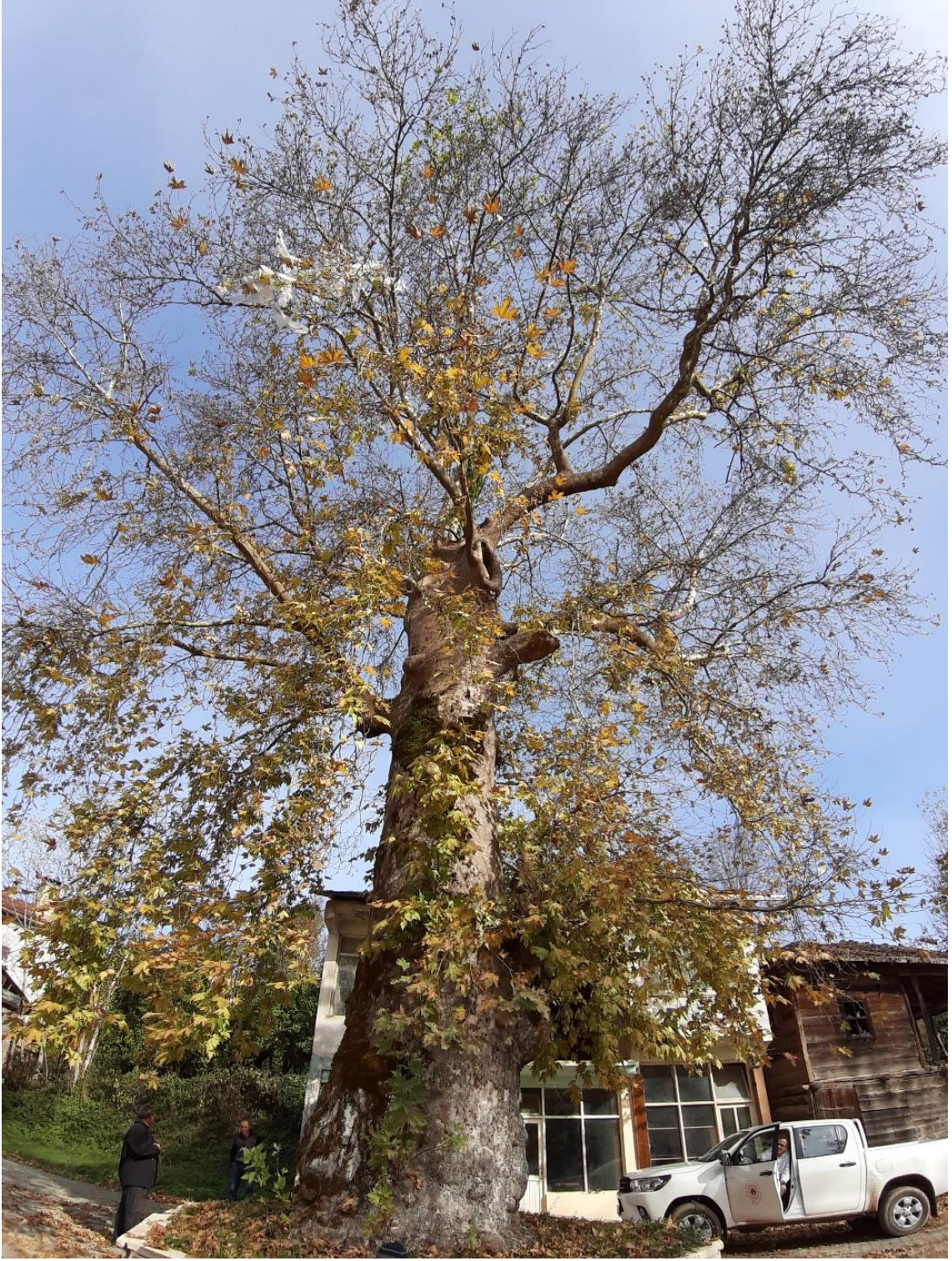
Şenpazar İlçesi, Harmangeriş Mevkii, Çınar Ağacı, tahmini yaşı (600)