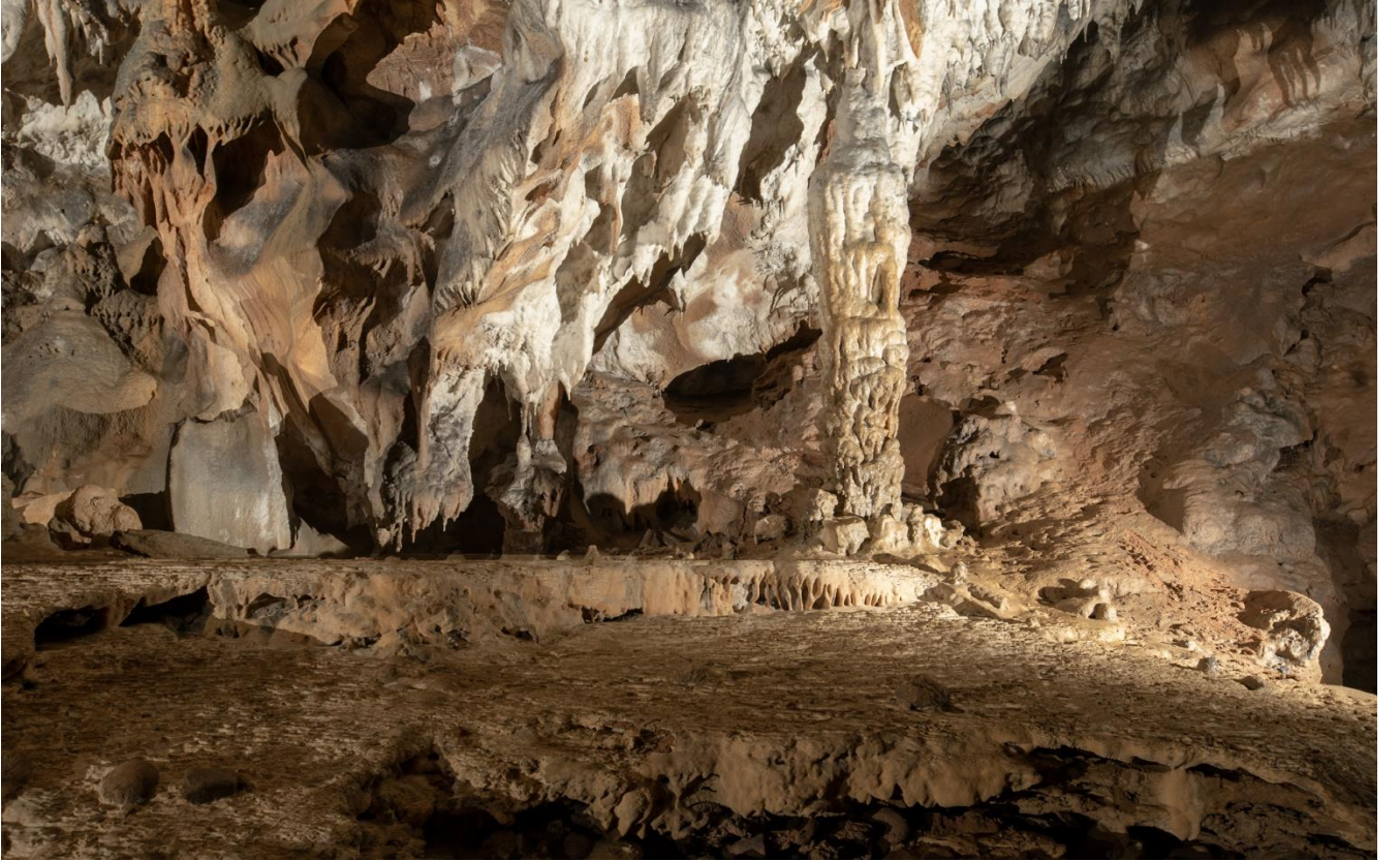
Cide İlçesi, Kılıçlı Mağarası