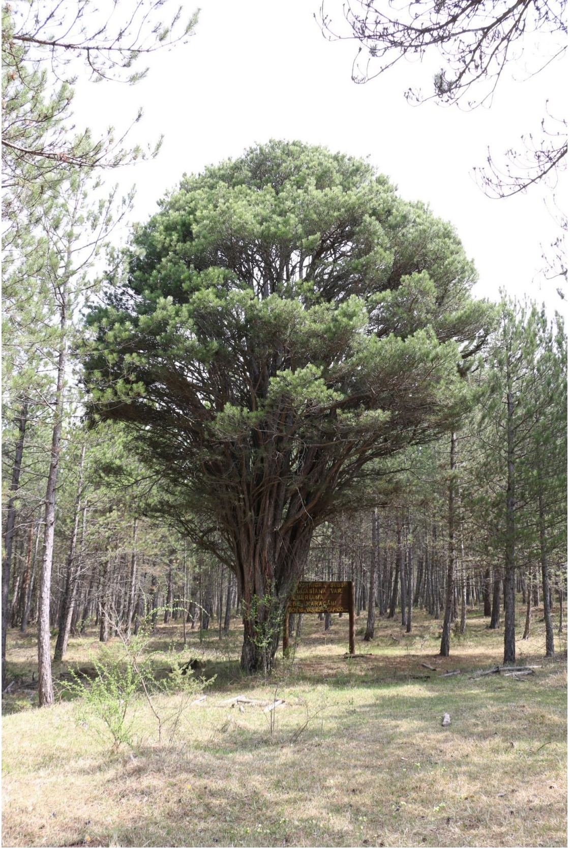
Kastamonu Merkez, Kıyık Köyü, Ebe Karaçanı tahmini yaşı (460)