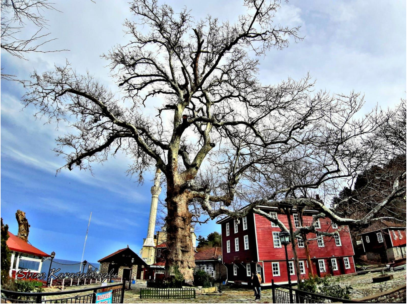
Bozkurt İlçesi, Beldeğirmeni Köyü, Çınar Ağacı, tahmini yaşı (850)