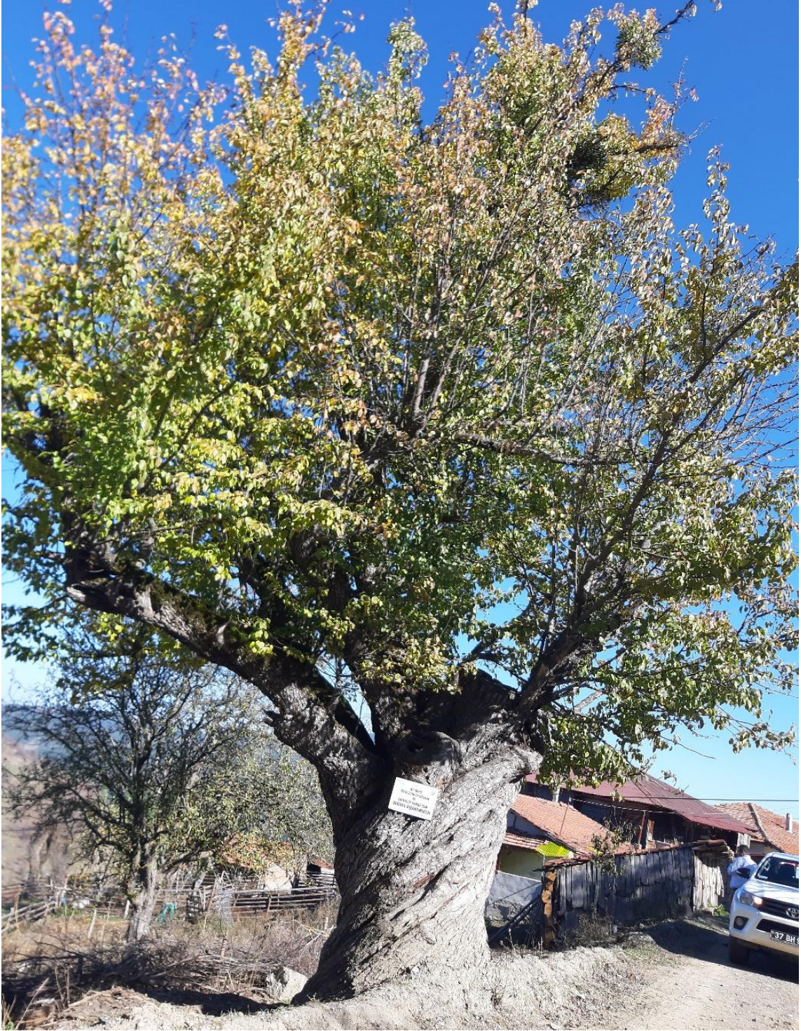
Taşköprü İlçesi, Dilek Köyü, Armut Ağacı, tahmini yaşı (400)