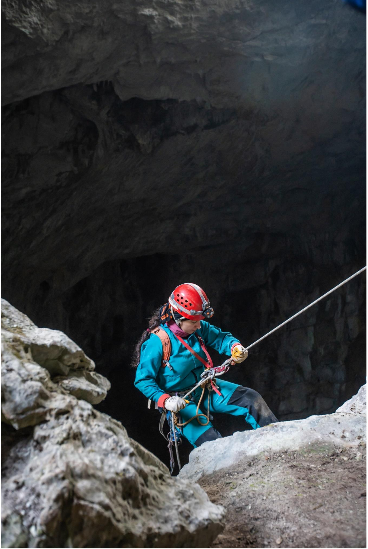
Pınarbaşı İlçesi, Ejder Çukuru Mağarası