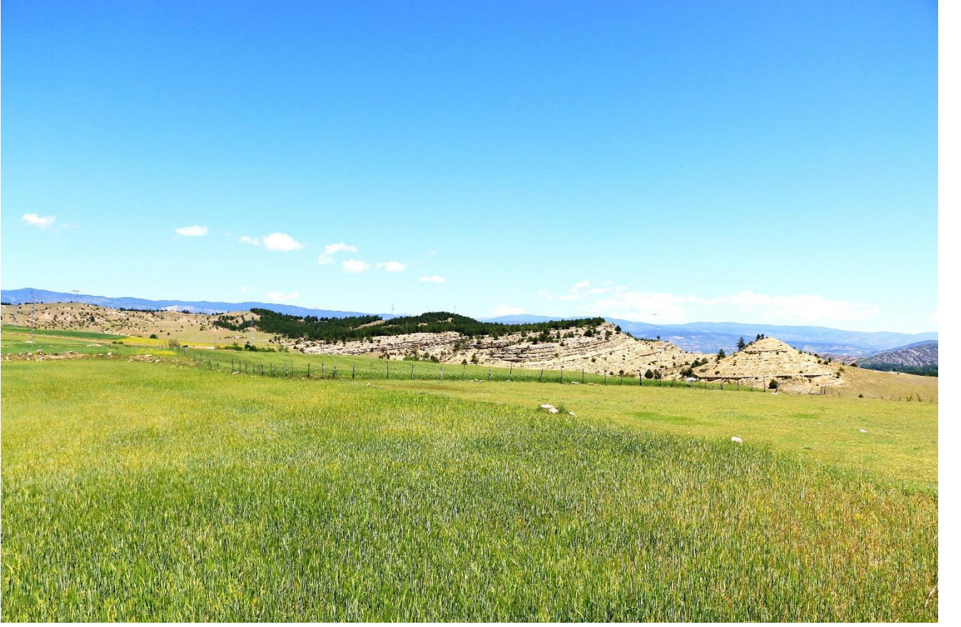
Taşköprü İlçesi, Zımbıllı Tepesi