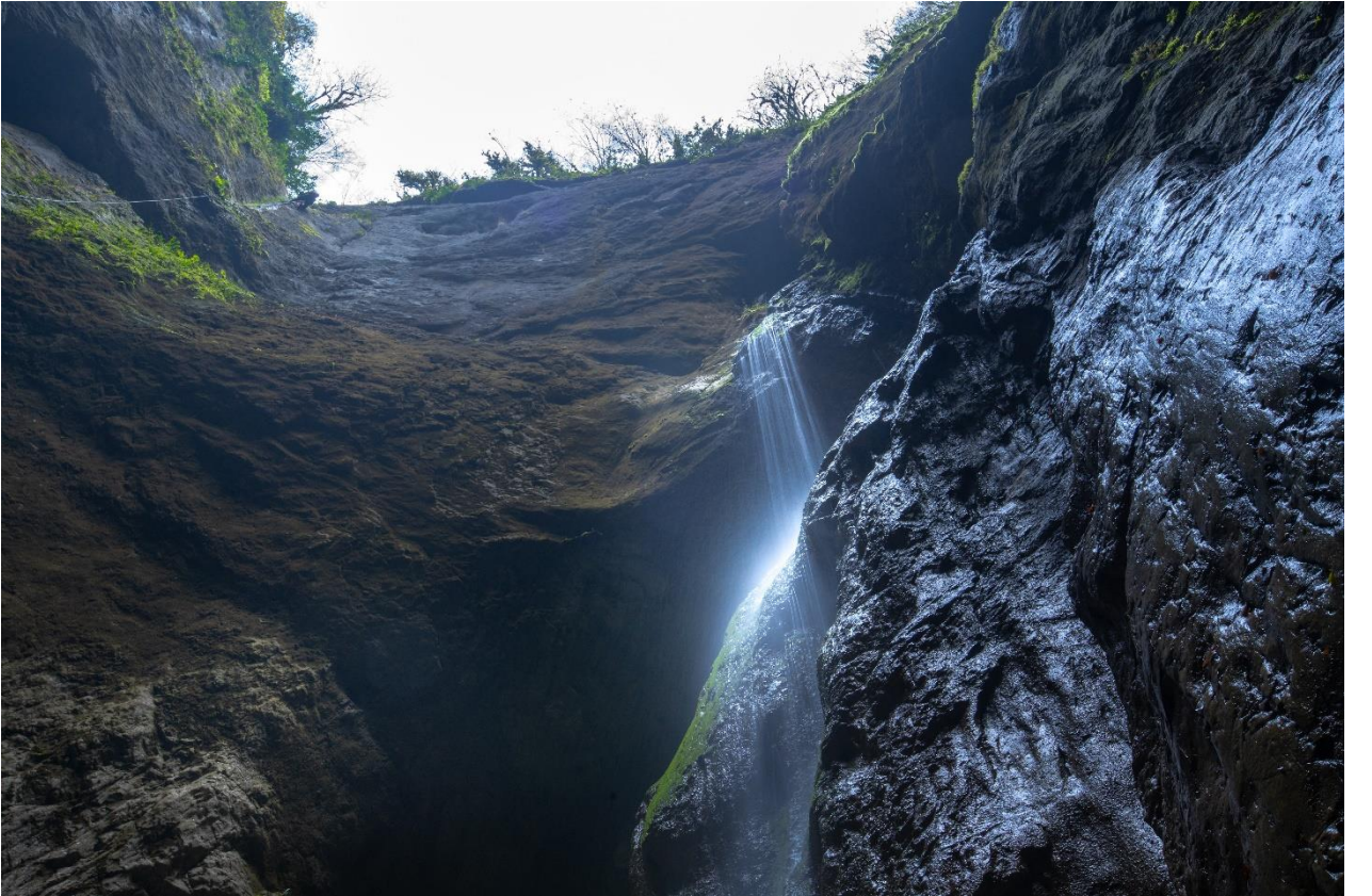
Őenpazar İlçesi, Dađlı Kuylucu