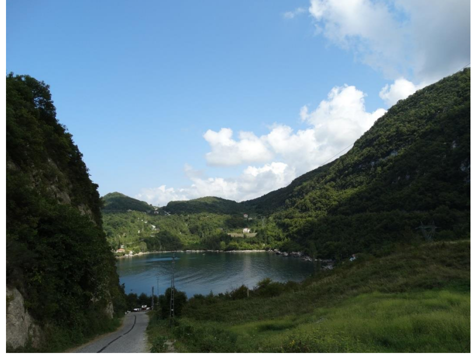
Cide, Kalafat Köyü, Gideros Koyu mevki