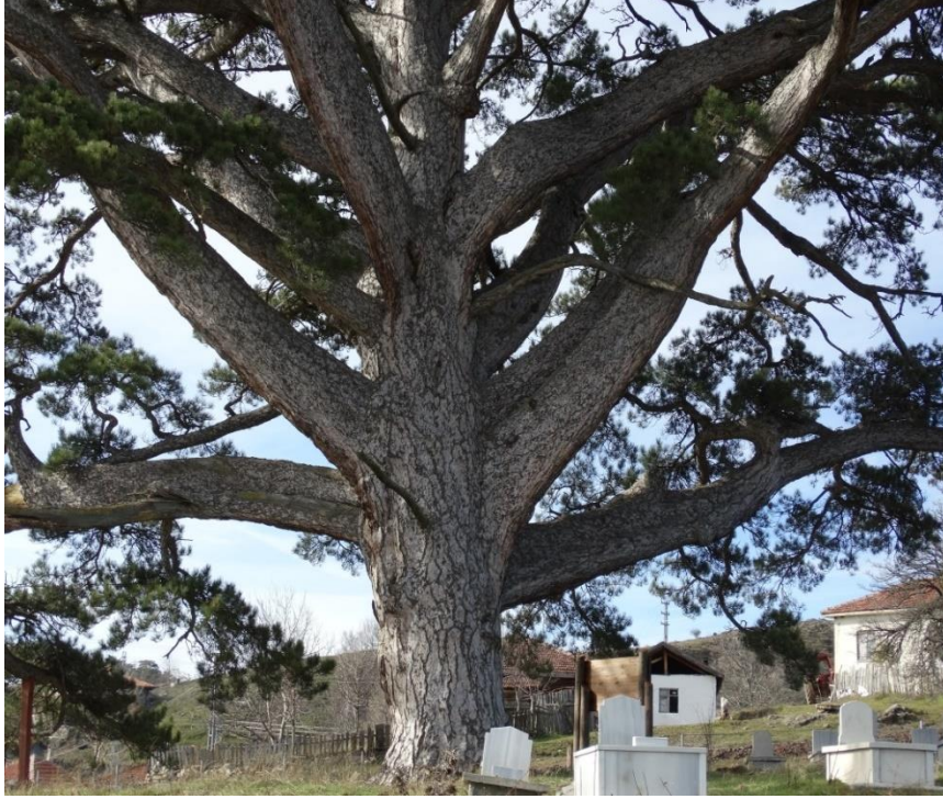
Araç, Bektüre Köyü, Karaçam ağacı