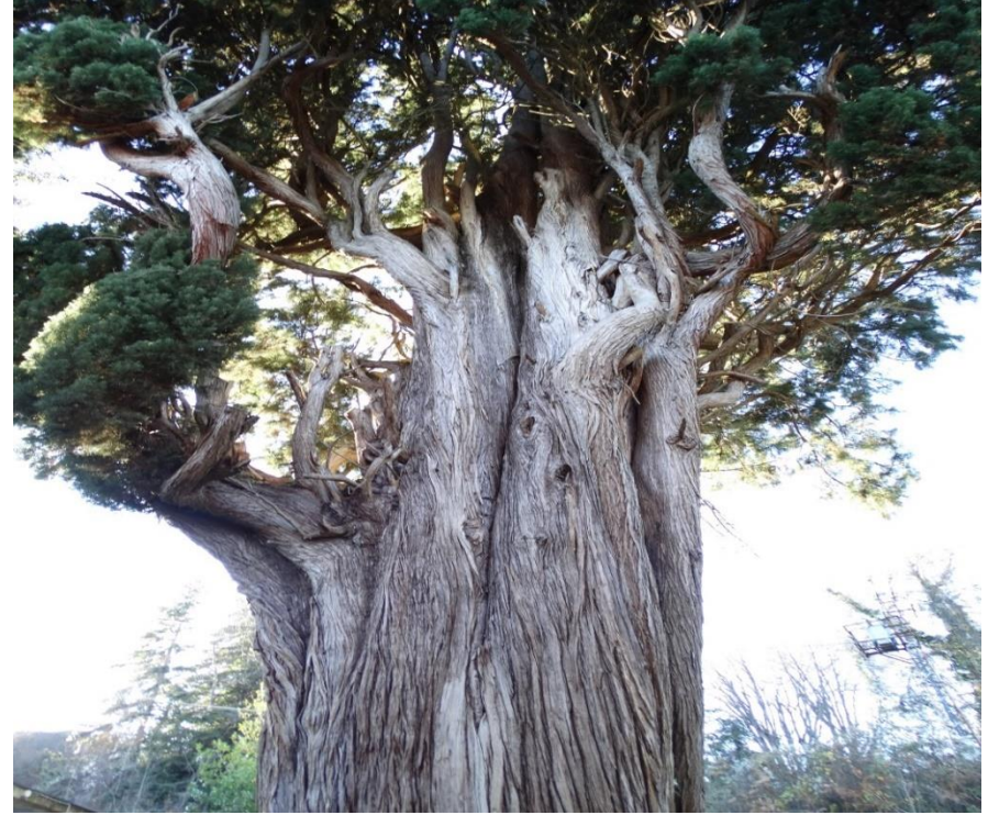
Çatalzeytin, Çağlar Köyü, Selvi ağacı

TOPLAMDA 64 ADET AĞACIMIZ TESCİLLENMİŞTİR