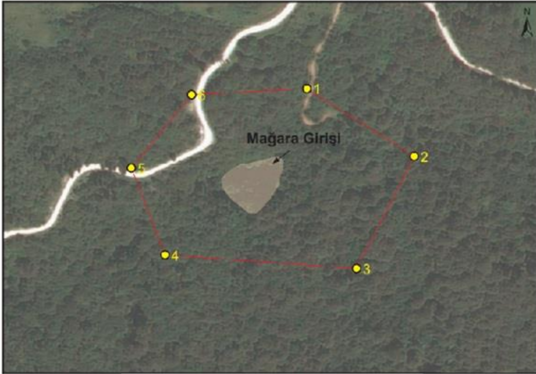
Kastamonu İli, Őenpazar İlçesi, Dađlı Ky Dađlı Kuylucu Mađarası'nın Koruma Alanı Sınırı ve Koordinat Listesi

Alana ait koordinat bilgileri, tvksays.csb.gov.tr adresinde mevcuttur.