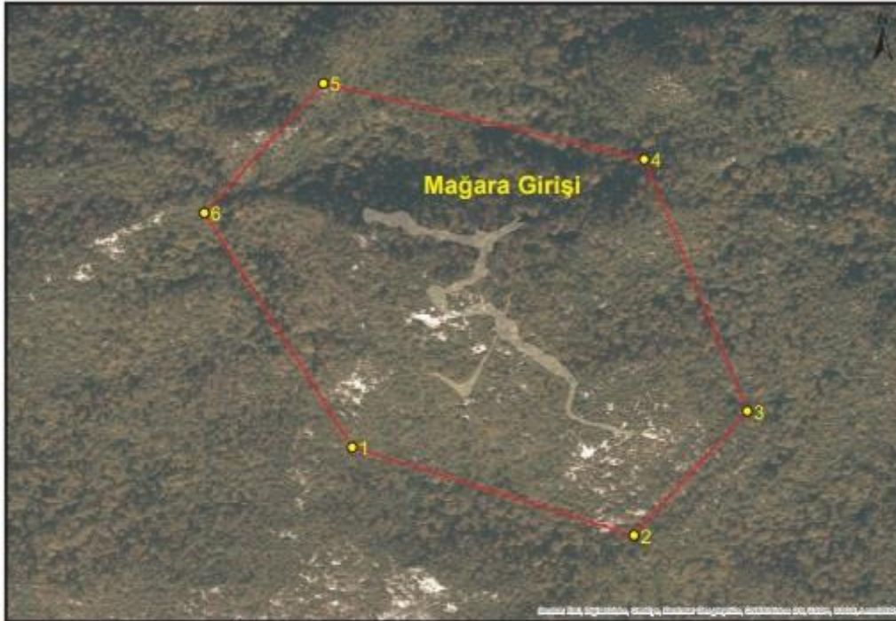
Kastamonu İli, Pınarbaşı İlçesi, Sümenler Köyü İlğarini Mağarası'nın Koruma Alanı Sınırı ve Koordinat Listesi

Alana ait koordinat bilgileri, tvksays.csb.gov.tr adresinde mevcuttur.