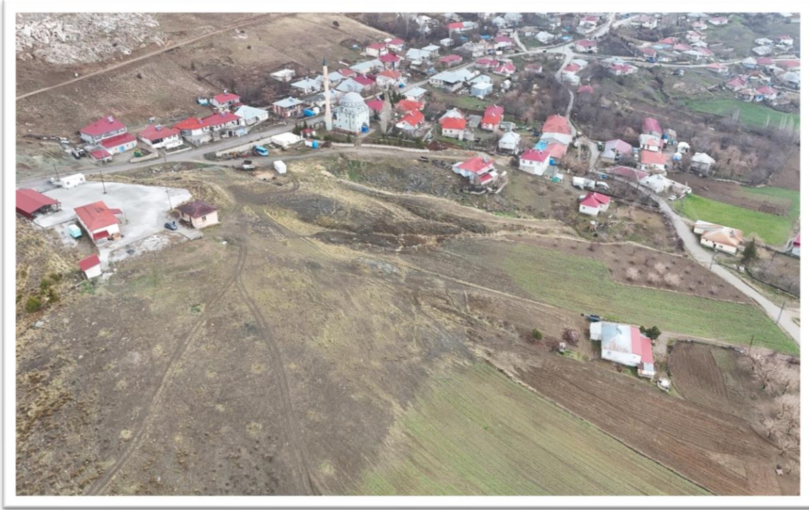
Fotoğraf 1: Parsel 123/5 ve Büyüktatlar Mahallesi'nin genel görüntüsü