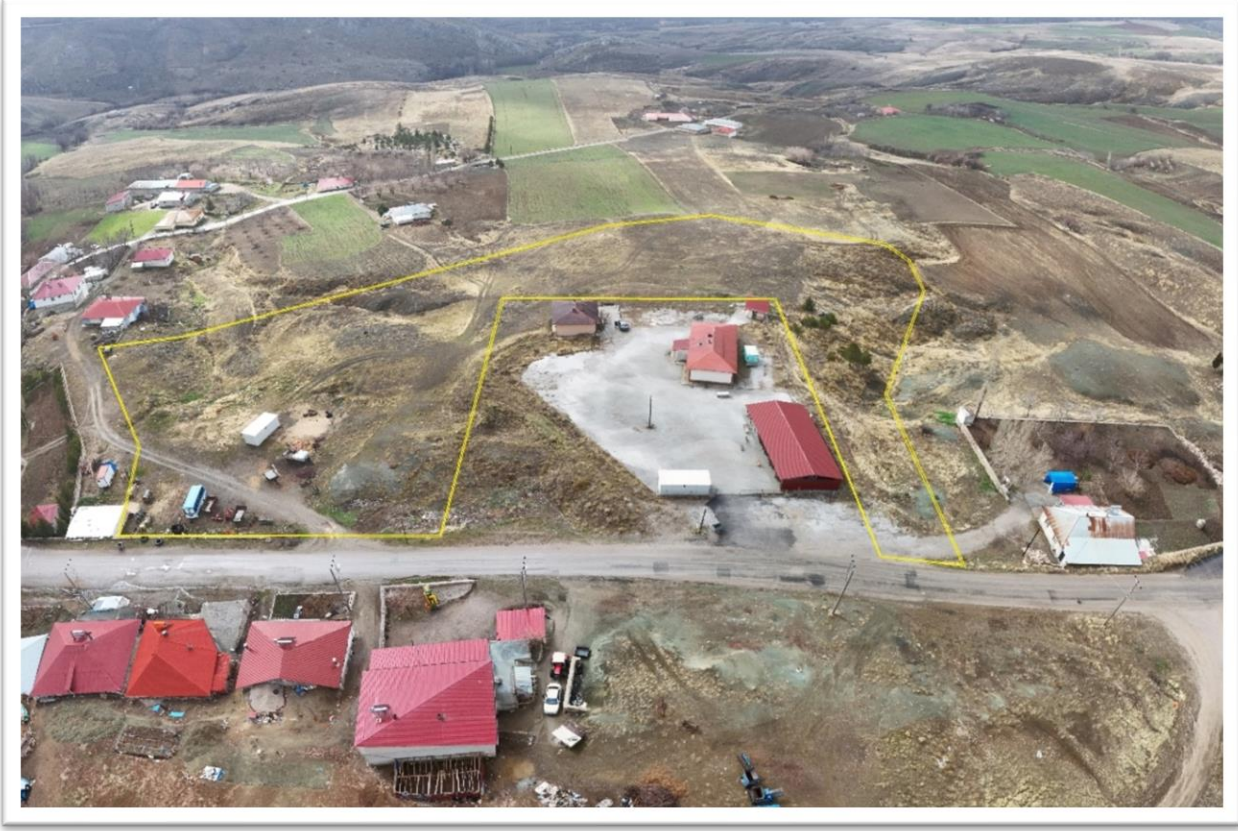
Şekil 2: Proje için ayrılan toplam alanın (123/5 Parsel) kuzey tarafından uydu görüntüsü

Parsel ve inşaat alanı ile yakın konut ve tesisler Şekil 3'te, yakın konut ve diğer tesislere olan mesafeler ve özellikler ise Hata! Başvuru kaynağı bulunamadı. 'de verilmiştir.