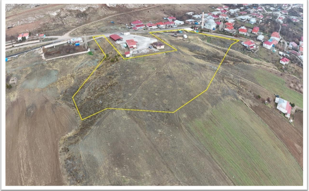
Şekil 1: Proje için ayrılan toplam alanın (123/5 Parsel) güney tarafından uydu görüntüsü

Yeni yerleşim alanının uydu görüntüsü aşağıda, Şekil 1: Proje için ayrılan toplam alanın (123/5 Parsel) güney tarafından uydu görüntüsü Şekil 2: 'de sunulmuştur.