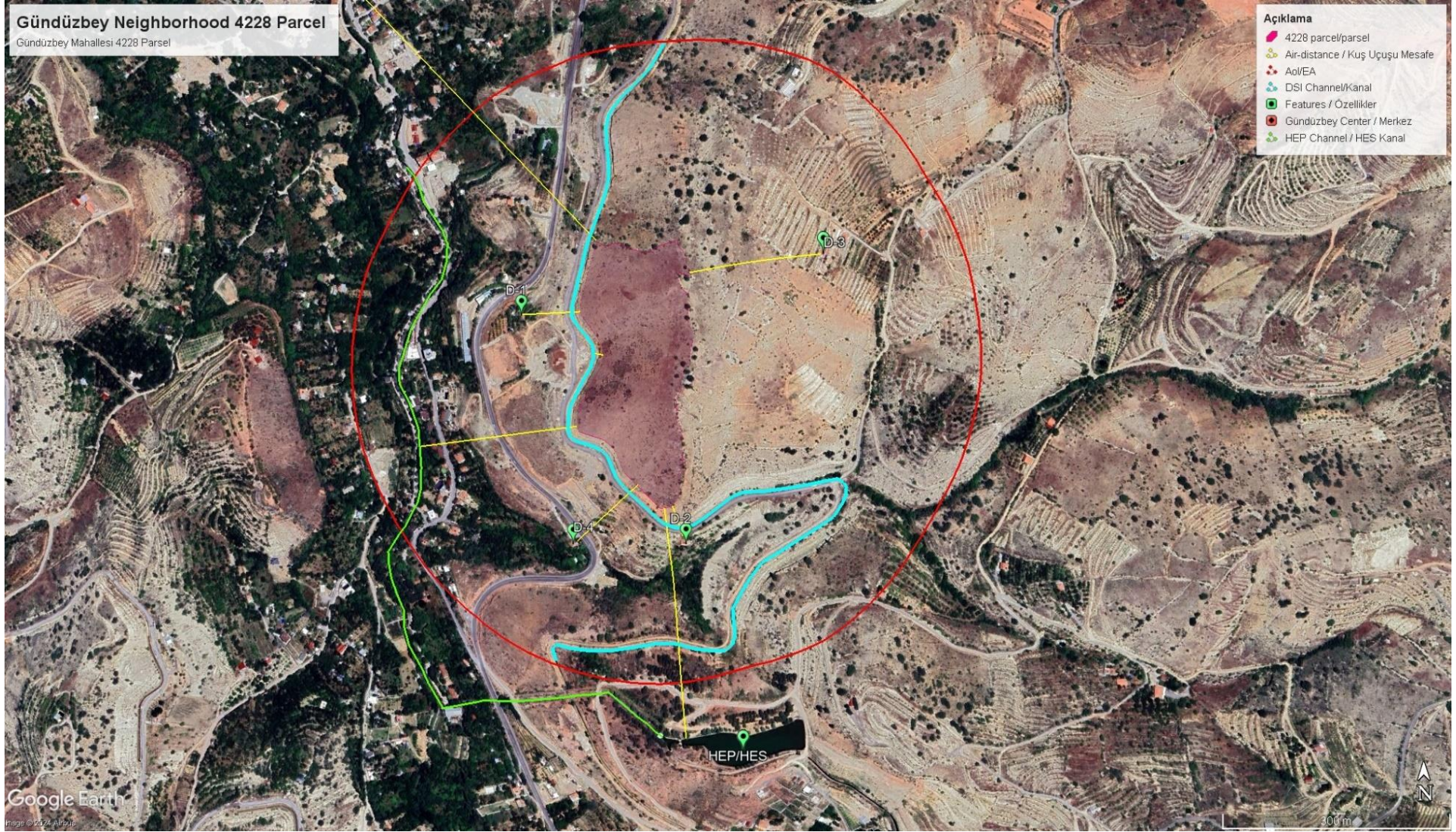
Şekil 2. Gündüzbey Proje Alanının Etki Alanı